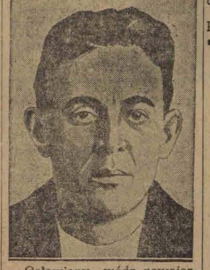
Oslawiony wódz nowojorskich bandytów, ścigany za szereg morderstw i włamań, zdołał uciec do Europy i tu został aresztowany w przedziale I klasy pociągu luksusowego Akwizoran — Wiedeń. (w)