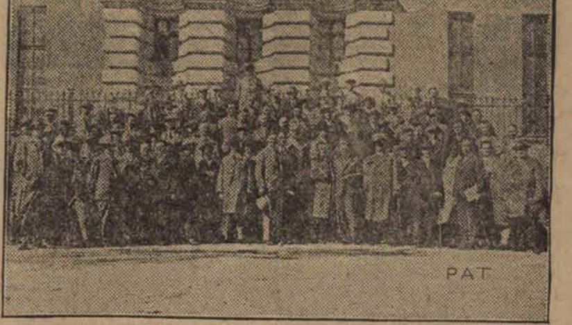
Grupa uczestników zjazdu inżynierów drogowych z całego kraju, który się odbył ostatnio w Katowicach.