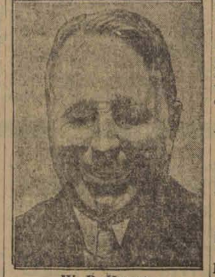
W. R. Hearst, właściciel olbrzymiego koncernu gazetowego w Stanach Zjednoczonych, został wydany z Francji za ogłoszenie w swoim czasie tajnych dokumentów anglo-francuskich. (w)