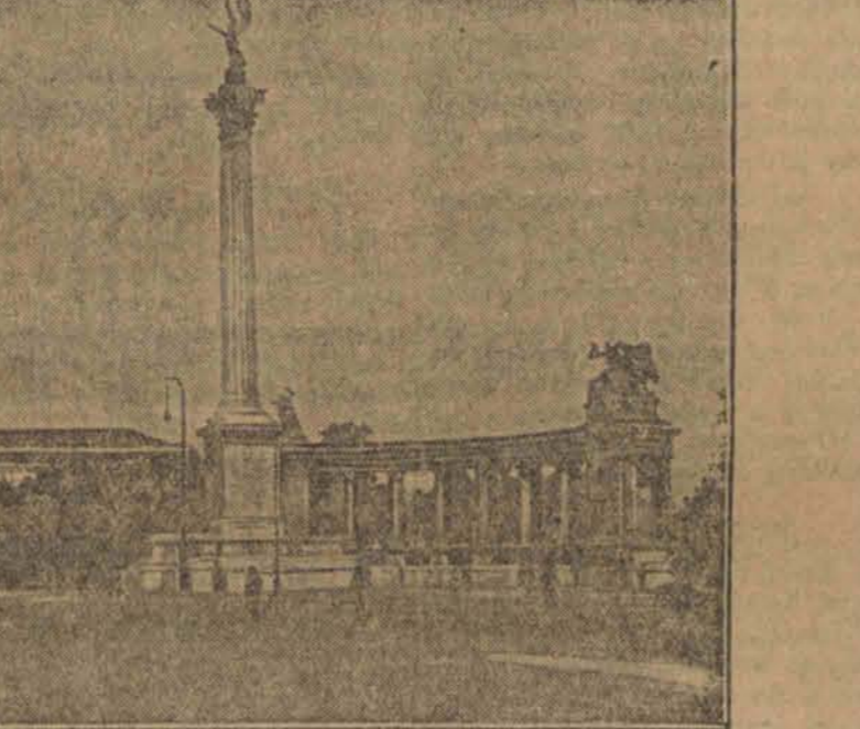
Pomnik tysiąclecia w Parku Miejskim w Budapeszcie, gdzie miały miejsce najbardziej krwawe i okropne okrucieństwa komunistyczne. (w lechach walki, przypominająca pierwszy przewrót bolszewicki na Węgrzech. Z okrzykami na cześć Béli Kuna i sowieckich Węgier bojówk, wśród których było też wiele niewiast, zupełnie oszalałych z podniecenia, rzuciły się przedewszystkiem na konną policję.