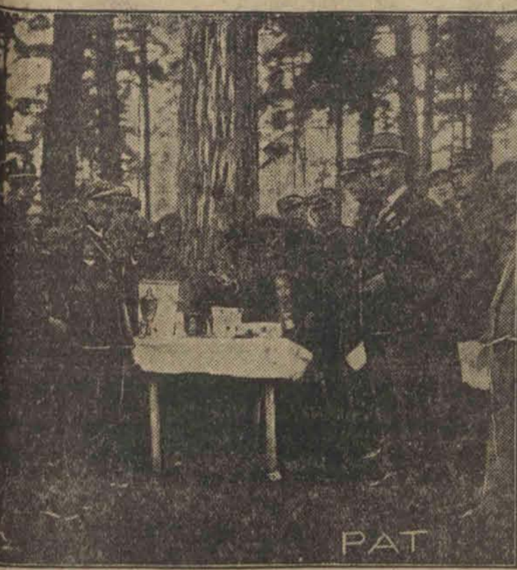
Fragm. wręczenia nagród zawodnikom.