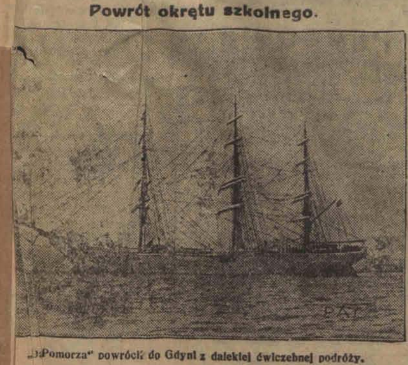
„Pomorza“ powrócił do Gdyni z dalekiej ćwiczebnej podróży.