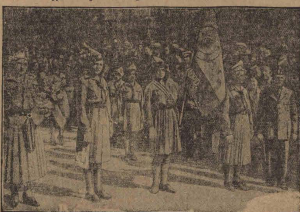
Młode „legionistki” hiszpańskie pod którym wziął udział korpus dyplomatyczny „święta rasy” w Madrycie, w tyczny i rząd.