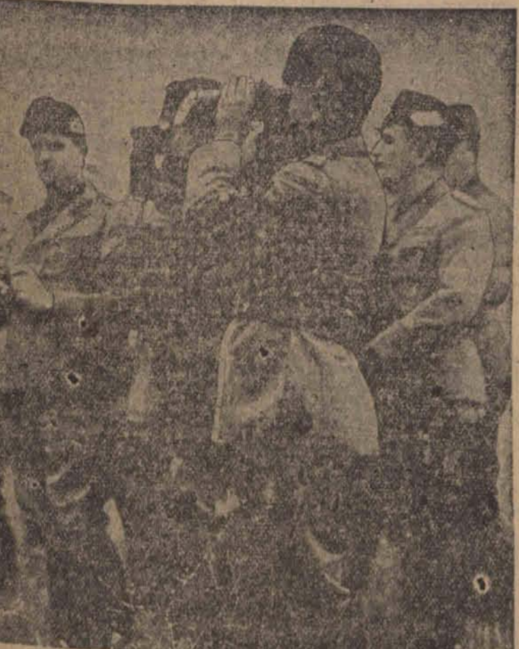
W Kampanie pod Rzymem licji faszystowskiej, w których wzięli udział Mussolini.