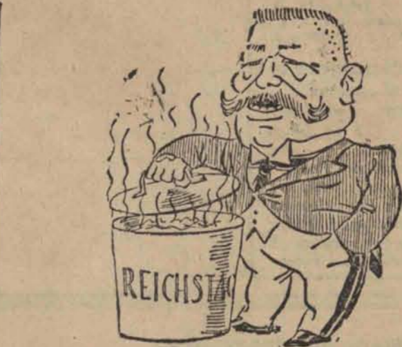
...prezydent Rzeczy niemieckiej otworzył pierwsze posiedzenie Reichstagu...

Do Sejmu z okr. Łódź-powiat złożono... 13 list.