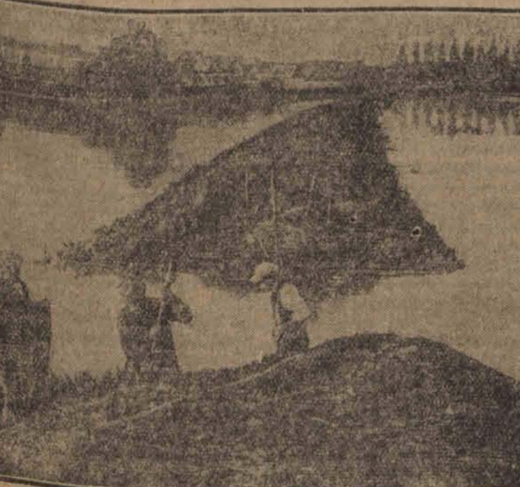
Wskutek długotrwałych deszczów całe pola i ziemie w prowincji Anwerpu stoja obecnie pod wodą.