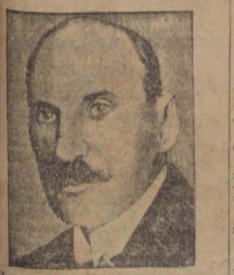
Henryk Haerberlin został wybrany prezydentem Szwajcarii na rok 1931.