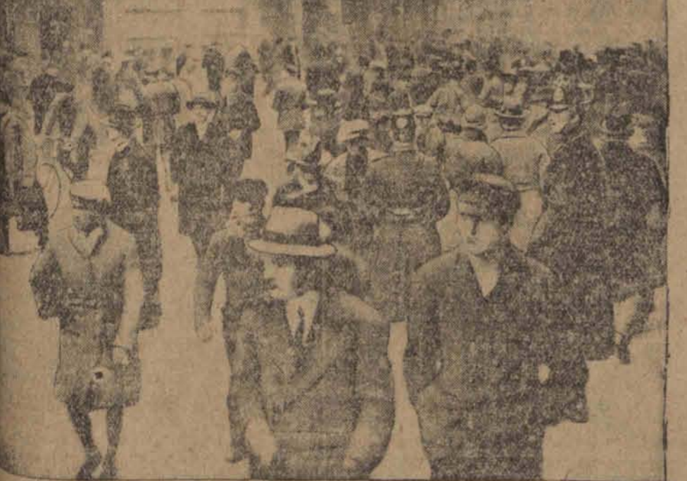
W Hamburgu jedna osoba została zabita, dwie śmiertelnie ranne. Na ilustracji moment rozprawy tłumów przez policję.