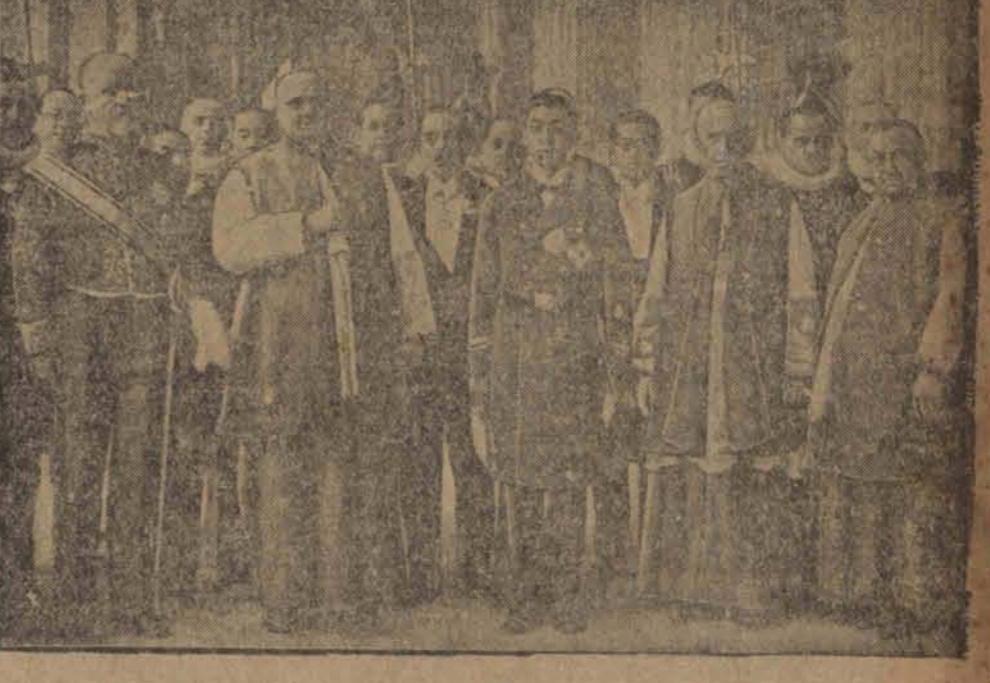
Okoliczności przyjęcia na audiencji brata cesarza japońskiego księcia Takamatsiu wraz z orszakiem.