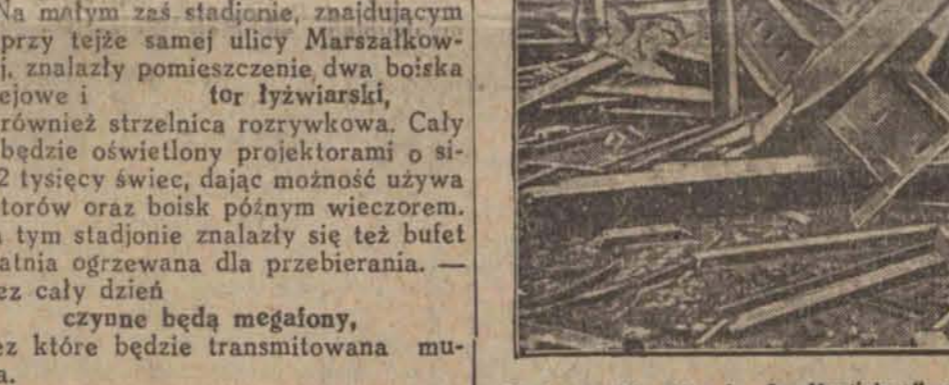
Na francuskim okręcie „La Maritlere”, przeznaczonym do przewożenia skazańców, a znajdującym się w porcie La Rochelle miała miejsce eksplozja, która zniszczyła całe wnętrze statku, zabiła mechanika i kilku robotników. (w)