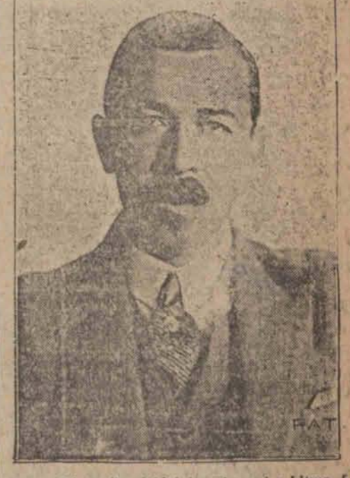
prezes delegacji polskiej do rokowań z Litwą. Rokowania miały na celu bezpośrednie porozumienie się Polski i Litwy dla uniknięcia możliwości incydentów granicznych, ale nie doprowadziły do porozumienia. —xx—