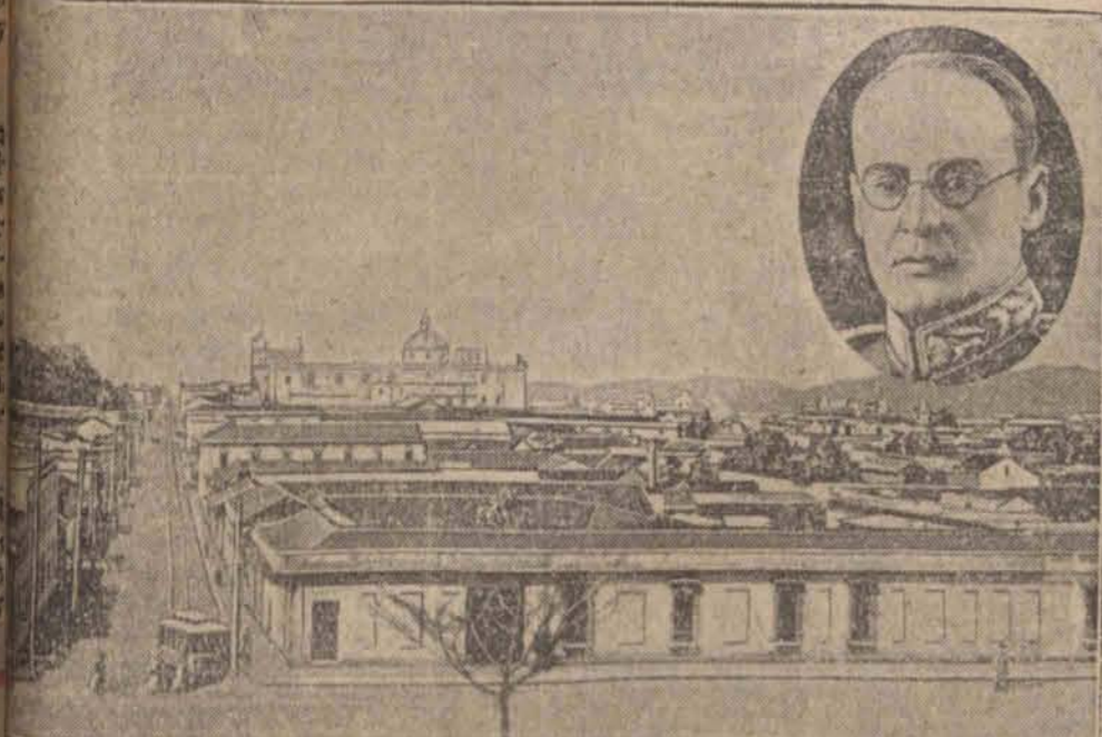
W Gwatemali stolica amerykańskiej rewolucji o tej samej nazwie, gdzie po krwawych walkach ulicznych usunięto rząd prezydenta Chacona. (w)