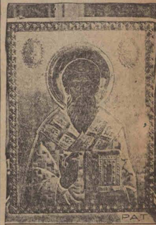
— dar patriarchy konstantynopolańskiego dla Pana Prezydenta Rzeczypospolitej.