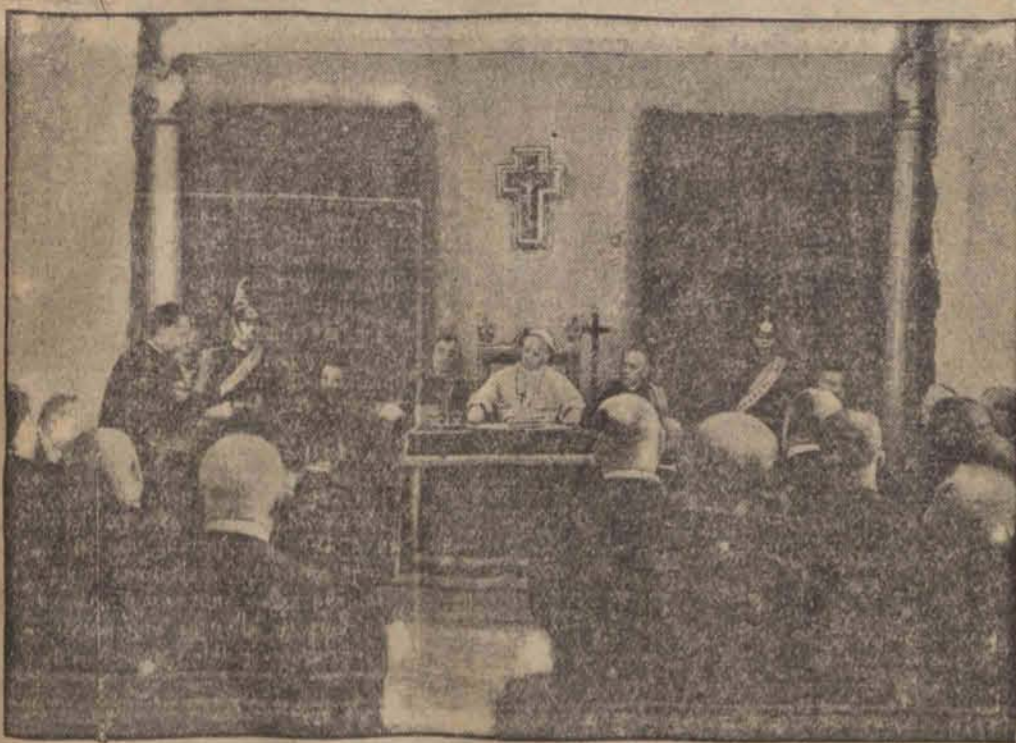
Ojciec Święty (pośrodku) dokonał uroczystego otwarcia kursu w rzymskiej Akademii Nauk. (h)