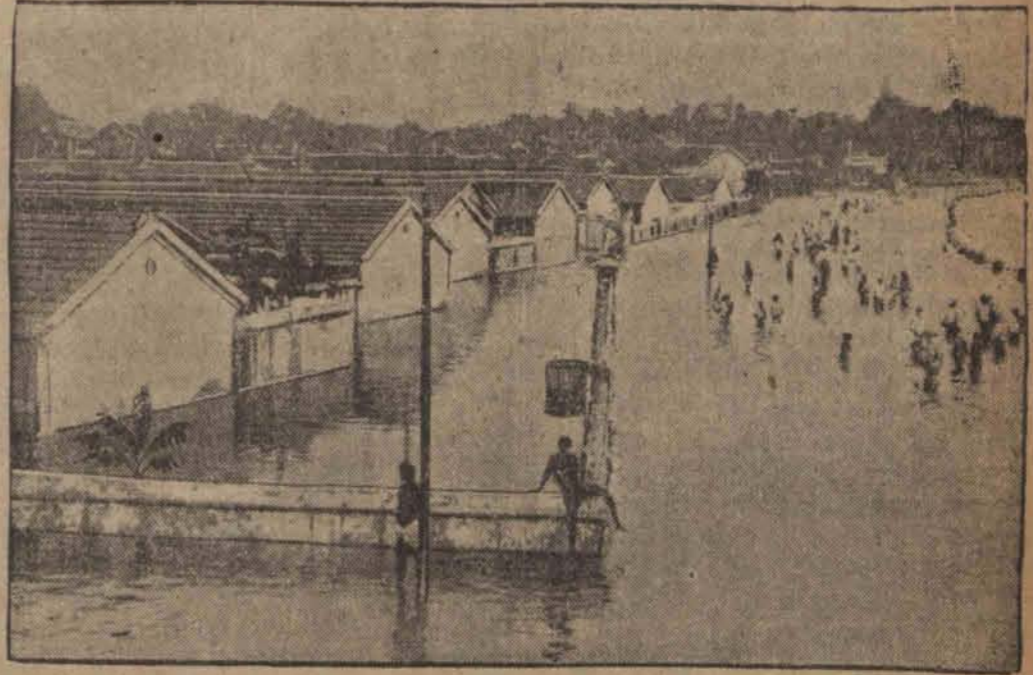
Zalane miasto Madras w Indiach. Miliony ludzi w niższej położonych częściach kraju musiało opuścić swe siedziby, aby uratować życie.