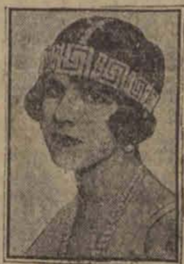
ustulowała według relacji pism angielskich podobieństwo samobójstwo przez zażycie wronału.