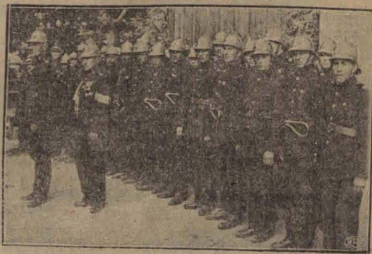
W tych dniach w Lutomińsku pod Łodzią obchodzono uroczysto 25-lecie straży ogniowej. Na zdjęciu dzielarski pluton z komendantem i adiutantem na czele.