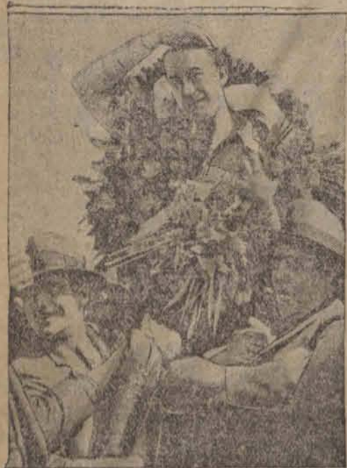
Lotnik duński Hojrlis, który przebył Atlantyk, został powitany owacyjnie po przybyciu do Kopenhagi.