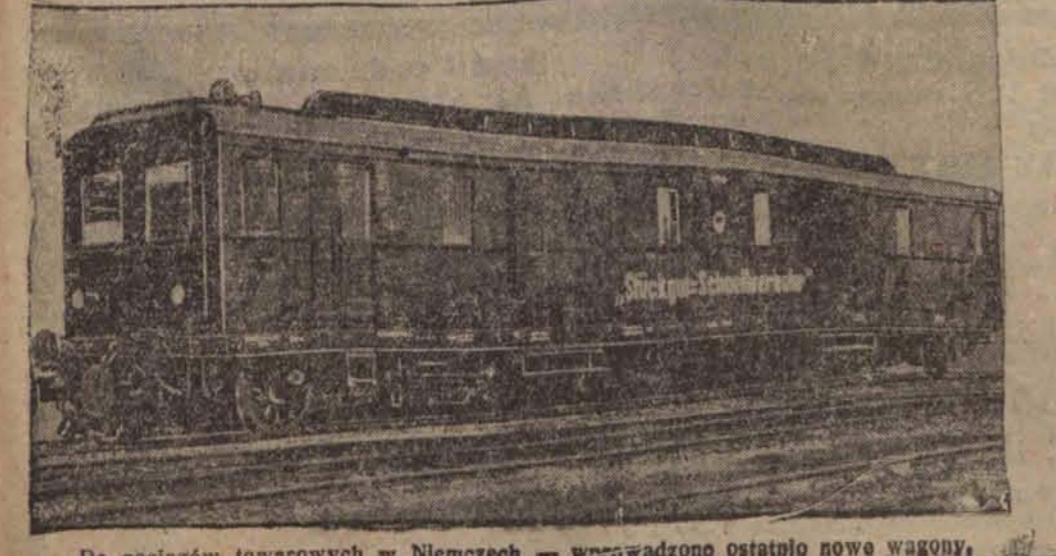
Do pociągów towarowych w Niemczech — wprowadzono ostatnio nowe wagony.