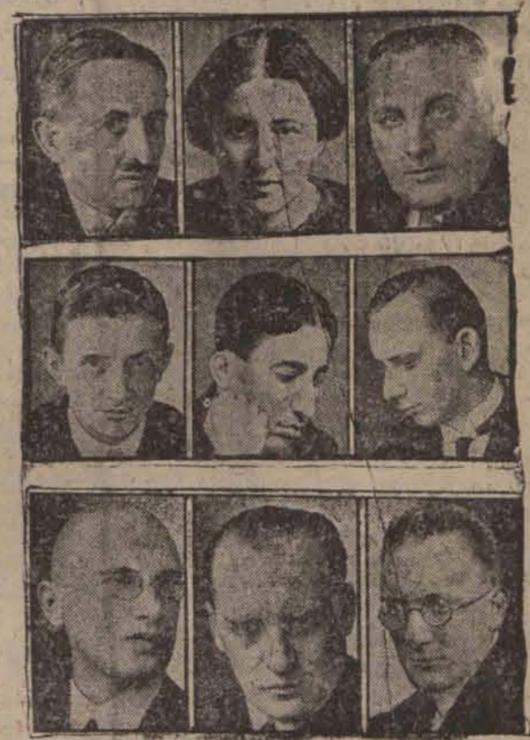
Czołowi uczestnicy: u góry: Ahves (Niemcy), Miss Mentschik (Anglia) i Bogolubow (Niemcy) W środku: Helling (Niemcy), Sultan Khan (Anglia) i Richter (Niemcy). U dołu: Tartakower (Polska), Aljochin (Francja) i Gronfeld (Austria). W Pradze rozpoczął się zacięty bój czołowych szachistów świata. Polska ma poważnych przeciwników w osobach przedstawicieli Niemiec i Austrii.