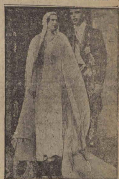
Księżniczka Ileana rumuńska i jej mąż arcyksiążę Antoni Habsburg po ślubie w Sinali, który odbył się według rytuału katolickiego.