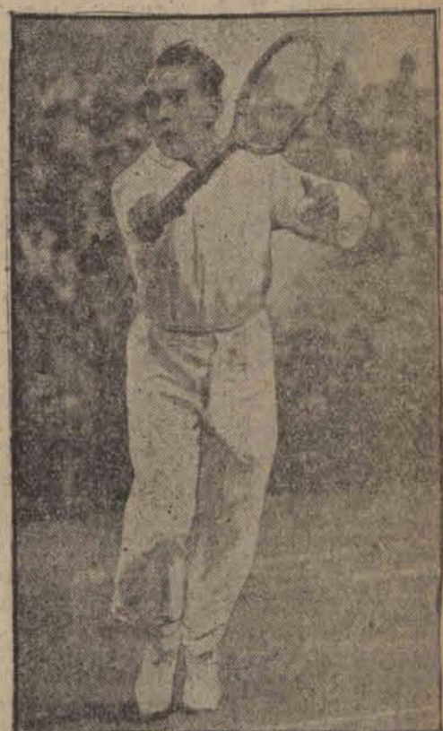
Henry Cochet, znakomity tenisista francuski zdobył dla swej ojczyzny puchar Dawisa.