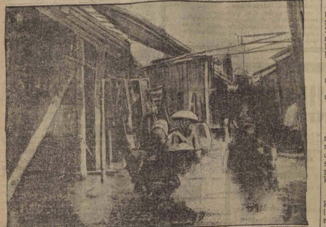
Pierwsze oryginalne zdjęcie z okolic nawiedzonych katastrofą powodzi w Chinach, gdzie 16 milionów ludzi musiało pozostawić cały dobytek by uratować swe życie. Całe miasta stały się pastwą fal, olbrzymie obszary skazane zostały na klęskę głodową.