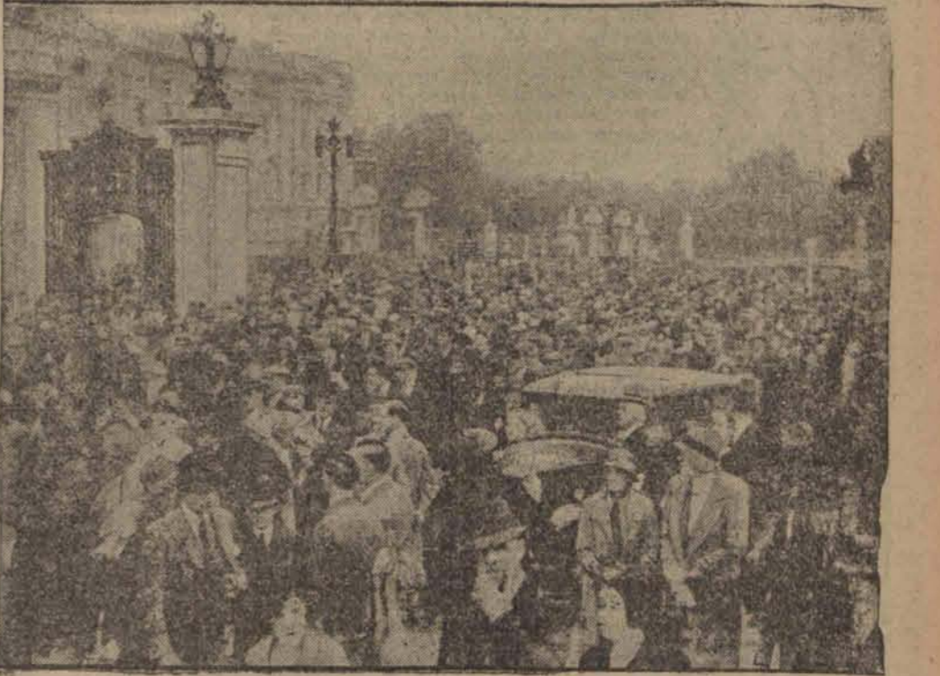
Tłumy oczekują przed pałacem królewskim na wiadomość o podpisaniu listu nowego gabinetu.

Sowiecki Tess wydał wczoraj komunikat, który zdaje się potwierdzać doniesienie Telegraphen — Union.