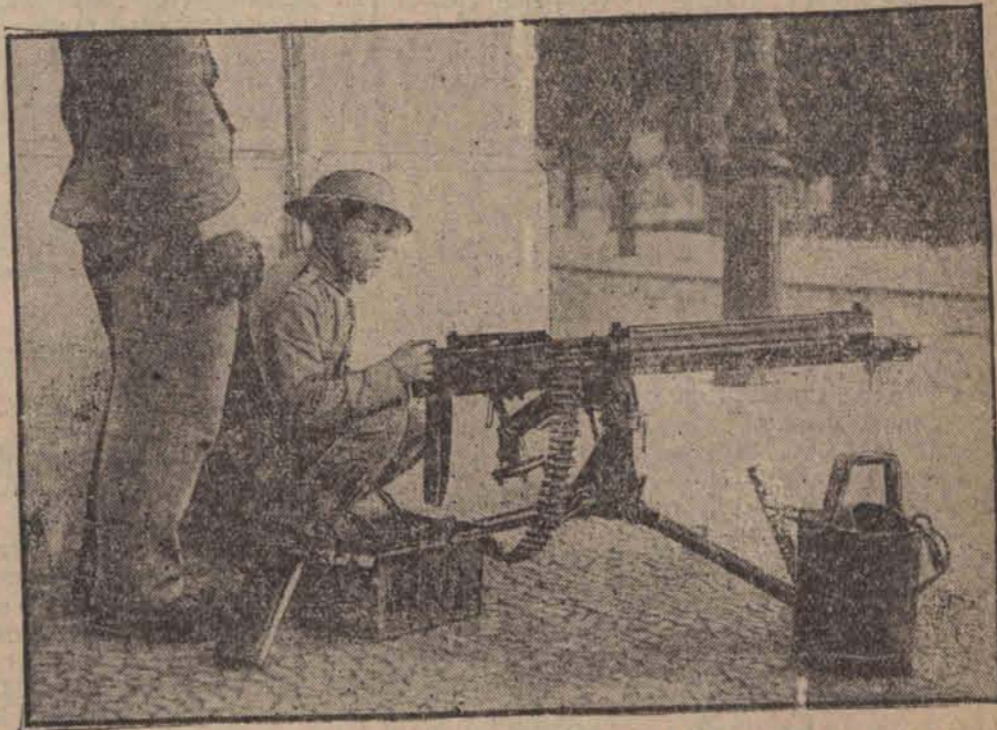
Karabin maszynowy wojsk rządowych na ulicach Lizbony. Rewolucja została krwawo stłumiona przez rząd prezydenta Carmony. 62 osoby poniosły śmierć, przeszło 300 zostało rannych.