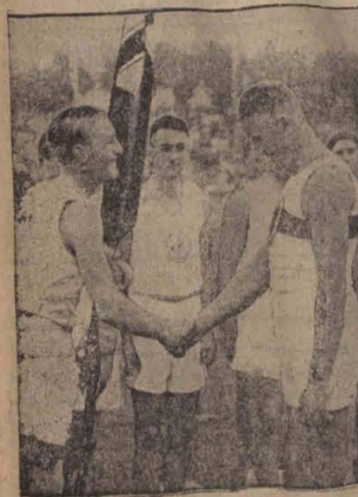
Lord Burghley, mistrz świata w biegu przez płotki (po lewej stronie) wita konkurencyjną drużynę.