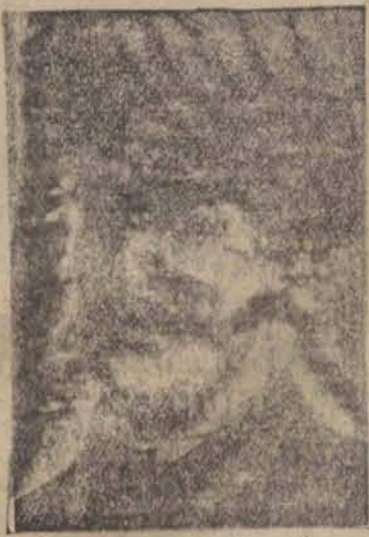
Arcyksiążę Leopold Salwator, którego przed kilku miesiącami przejechało w Wiedniu auto, zmarł.