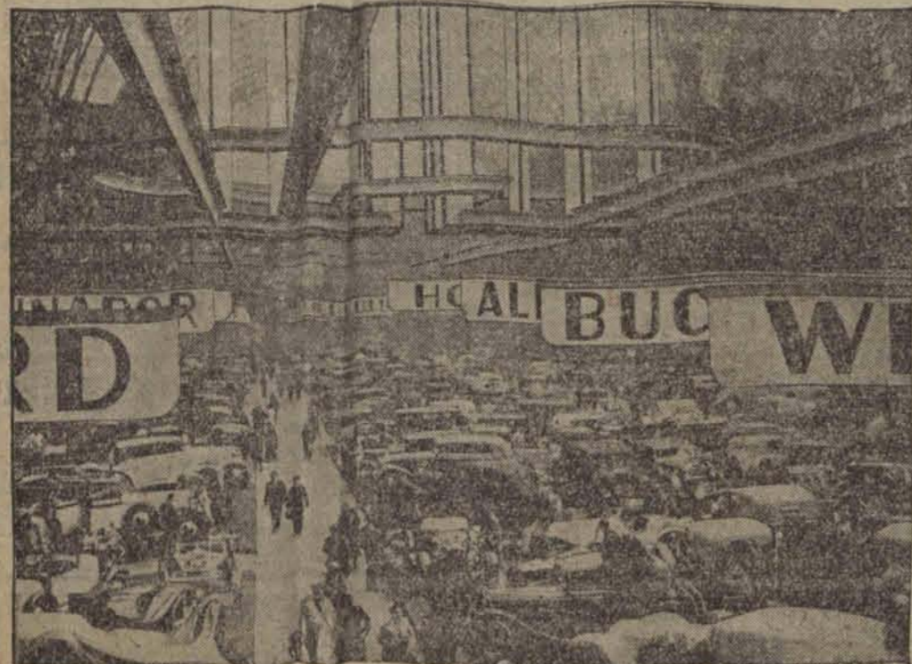
Olbrymnia hala otwartej w niedzielę wystawy samochodowej w Paryżu.