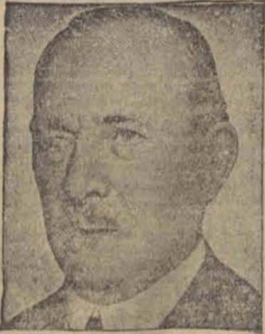
Erik Karlfeldt zmarły lyryk szwedzki, któremu przyznano nagrodę Nobla w dziedzinie literatury.