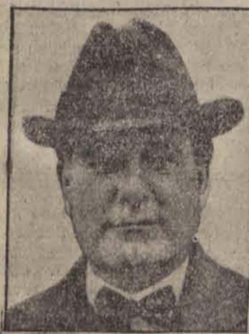
SENATOR BORAH, którego wystąpienia w obronie Sowietów i przeciw Francji oraz Polsce mają już ustaloną „stawę”.