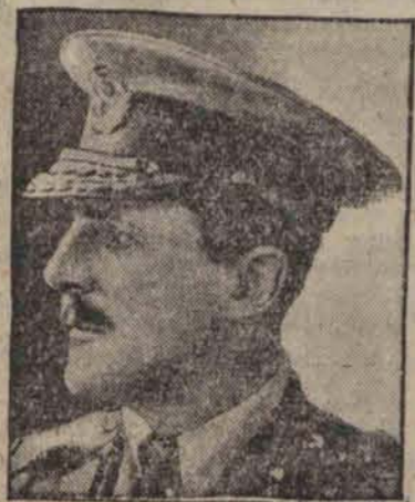
Sir RONALD STORRS angielski gubernator Cypru.