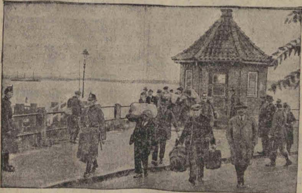
Powracające do Hamburga załogi okrętów niemieckich, które zbuntowały się w Leningradzie, zostają natychmiast po wylądowaniu aresztowane przez policję niemiecką.