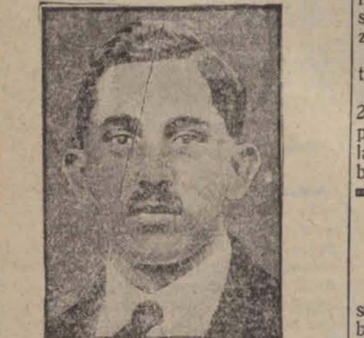
Sahabazada Nawab Azam Jah, najstarszy syn i dziedzic legendarnie bogatego królestwa Hajderabadu (Indie) zaręczył się z córką byłego kalifa Abduli Medżida.

O znacznym zdemokratyzowaniu angielskiej śmietanki świadczy fakt, że rodzice narzeczonego nie widzą bynajmniej nic niestosownego w małżeństwie syna i utrzymują jak najlepsze stosunki z tancerką, która ma zostać ich synową.