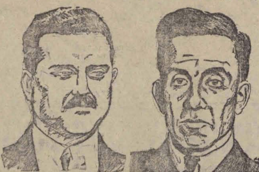
Guggari, prezydent Paragwaju został zmuszony do ustąpienia przez elementy radykalne. D. Luis Sanchez Cerro, został wybrany prezydentem Peru na miejsce b. prezydenta Leguia.