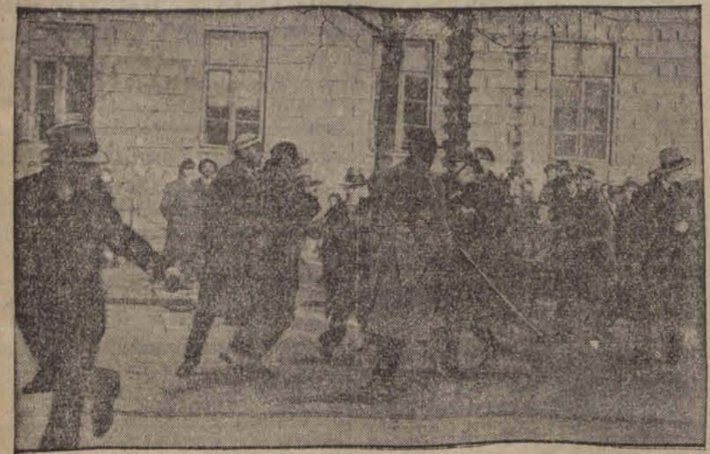
Policja rozprasza bojówkę tragarzy żydowskich, którzy zebrał się w pobliżu uniwersytetu.