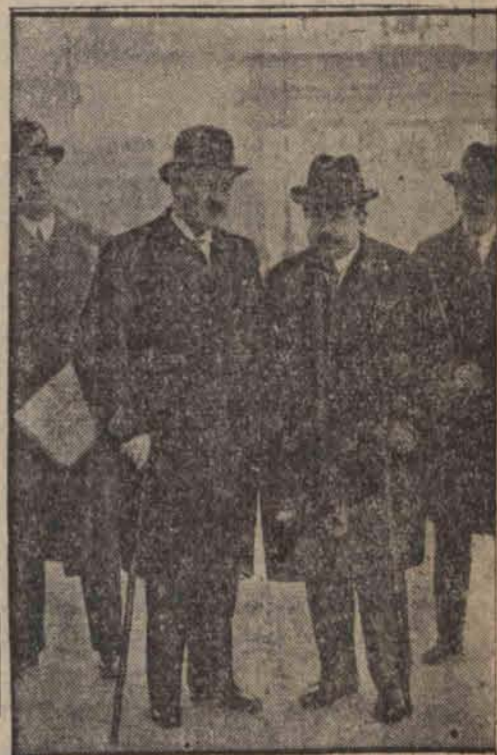
Do Berlina przybył b. premier francuski Painlevé który jest znanym matematykiem i chce odwiedzić Einsteina. Na zdjęciu: ambasador Francji Poncet i Painlevé (w miękkim kapeluszu).