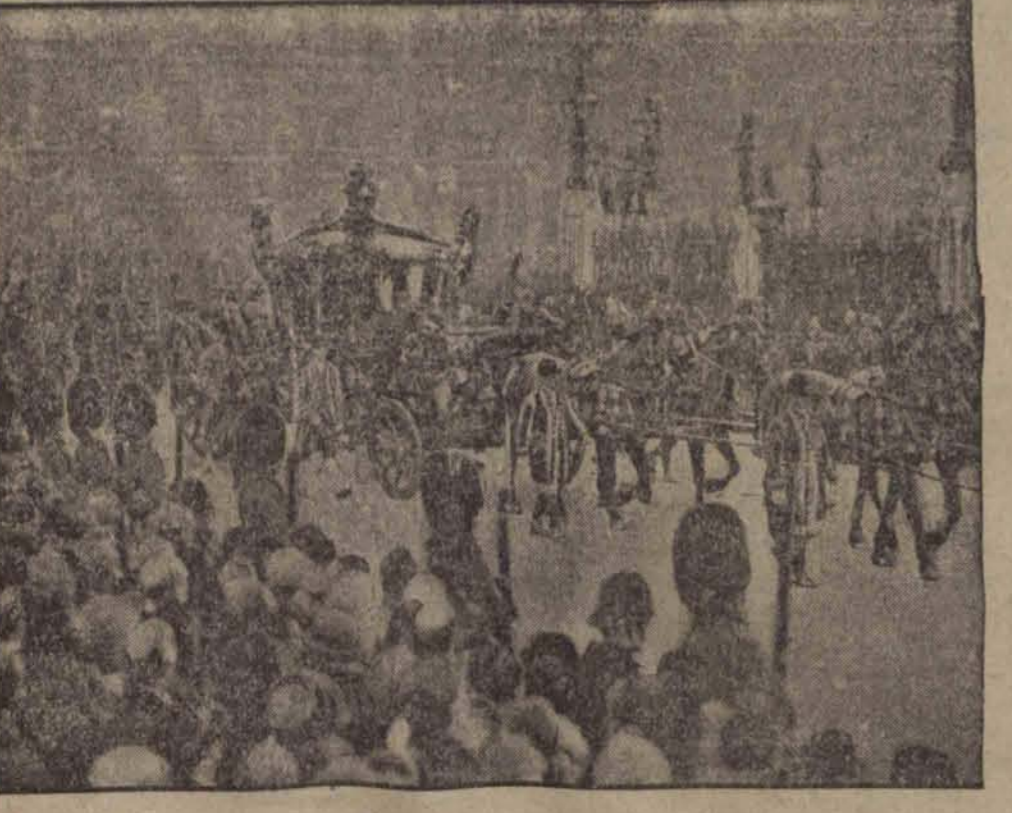
Przyjazd króla i królowej angielskiej do gmachu parlamentu na otwarcie pierwszego posiedzenia nowej Izby Gmin.

Chińska izba handlowa zwróciła się z prośbą do przedstawicieli dyplomatycznych państw europejskich w Tien-Tsinie by oddziały wojsk służące do obrony koncesyj, europejskich zostały użyte celem opanowania sytuacji. Wojska europejskie nie wydadają się jednak poza obręb swoich koncesyj, natomiast wojska japońskie biorą udział w walce.