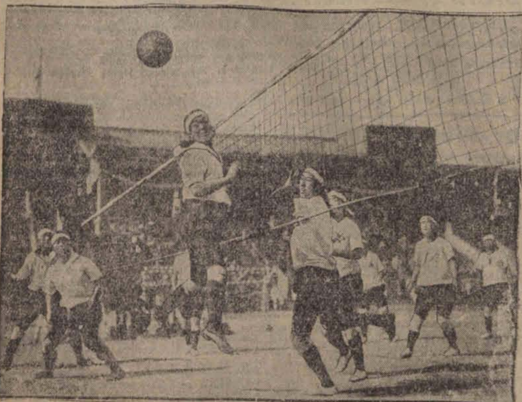
Uczenice japońskiej szkoły żeńskiej podczas gry w piłkę siatkową.