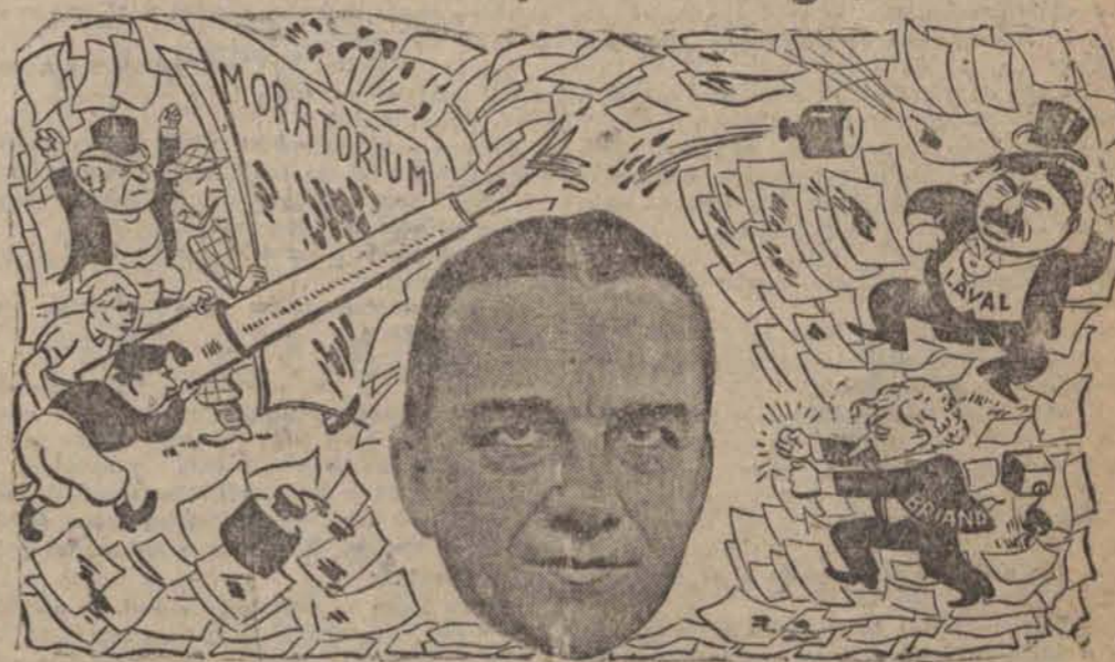
Owen Young, twórca planu spłat reparyacyjnych, dookoła którego toczy się obecnie walka o moratorium.