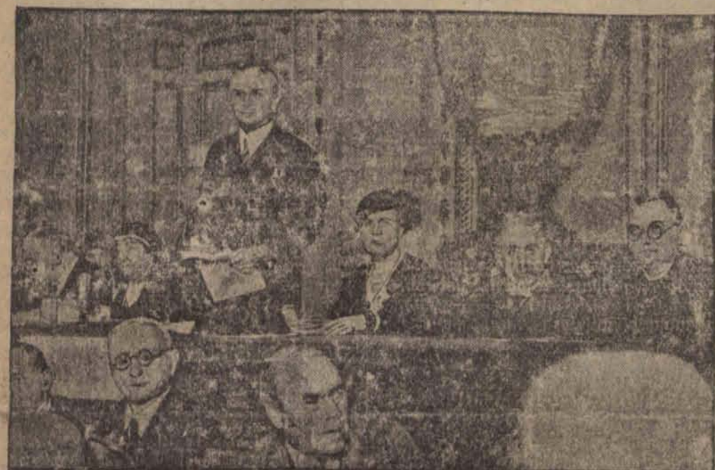
Na konferencji w Paryżu, zwołanej przez komitet organizacyjny międzynarodowego kongresu rozbrojeniowego, która stała się właściwie propagandą niemieckich tendencji odwetowych, doszło do zajść. Na zdjęciu prezydium kongresu.