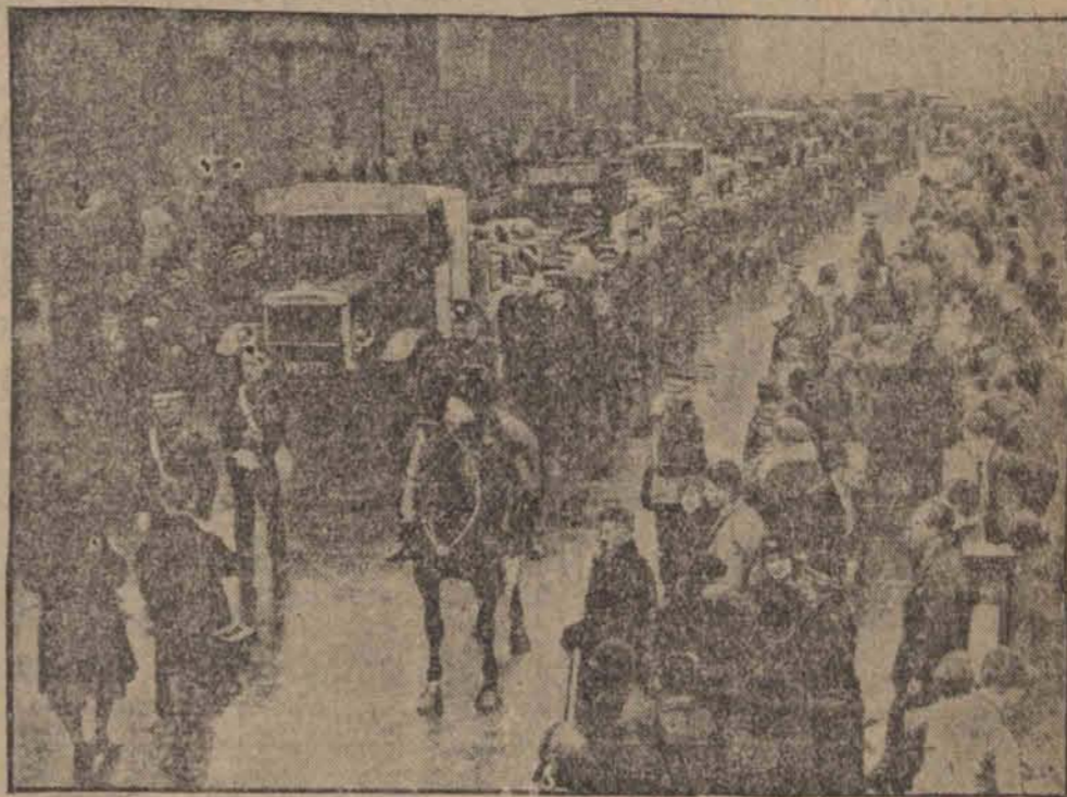
W Arksey odbył się olbrzymi pogrzeb 46 ofiar katastrofy górniczej w kopalni Bentley koło Doncaster (Anglia).