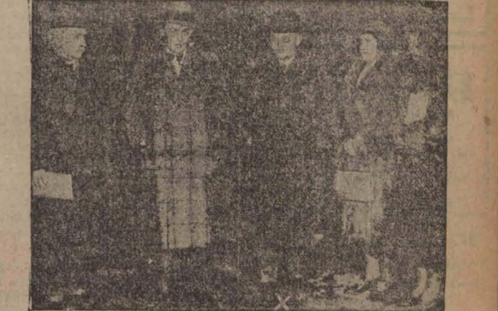
Przybycie profesora Bosza, laureata w dziedzinie chemii, wraz z rodziną na dworzec w Sztokholmie.