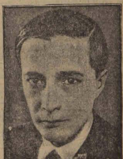
Profesor Polanyi wynalazł lampę w której świeci zwykła sól kuchenna, która składa się z chlorku i sodu. Te pierwiastki, stykające się w próżni dają jasne przyjemne dla oka światło. (f)