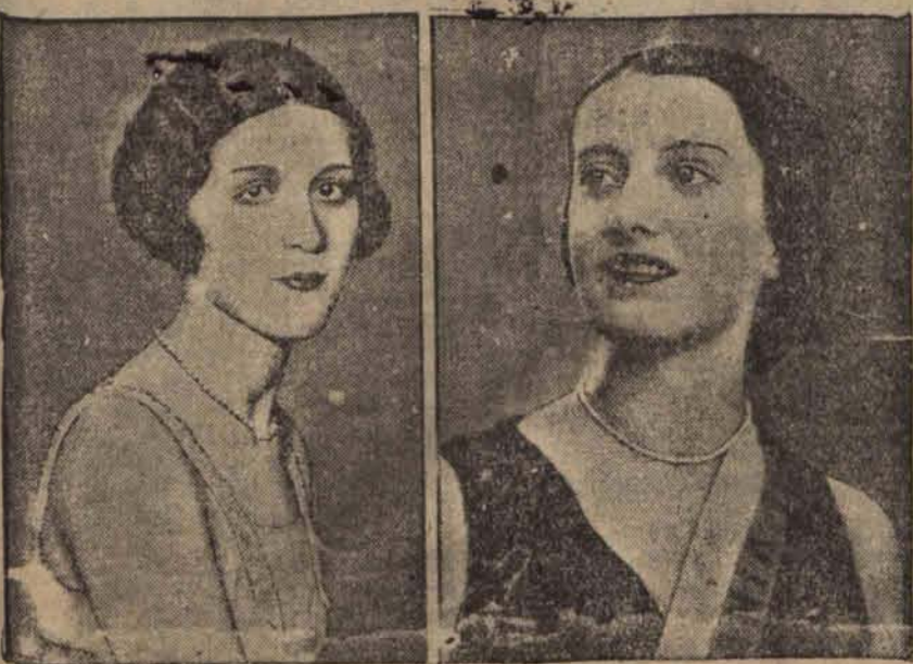
Miss Francia 1931 r.