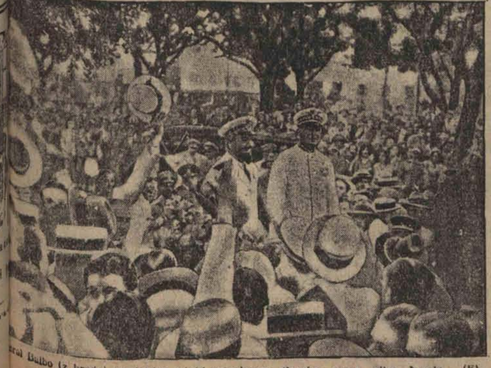
Entuzjastyczne przyjęcie włoskich lotników w Brazylii. (F.)