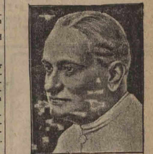
Pandit Motilal Nehru zastępca Gandiego zmarł po powrocie swego mistrza.