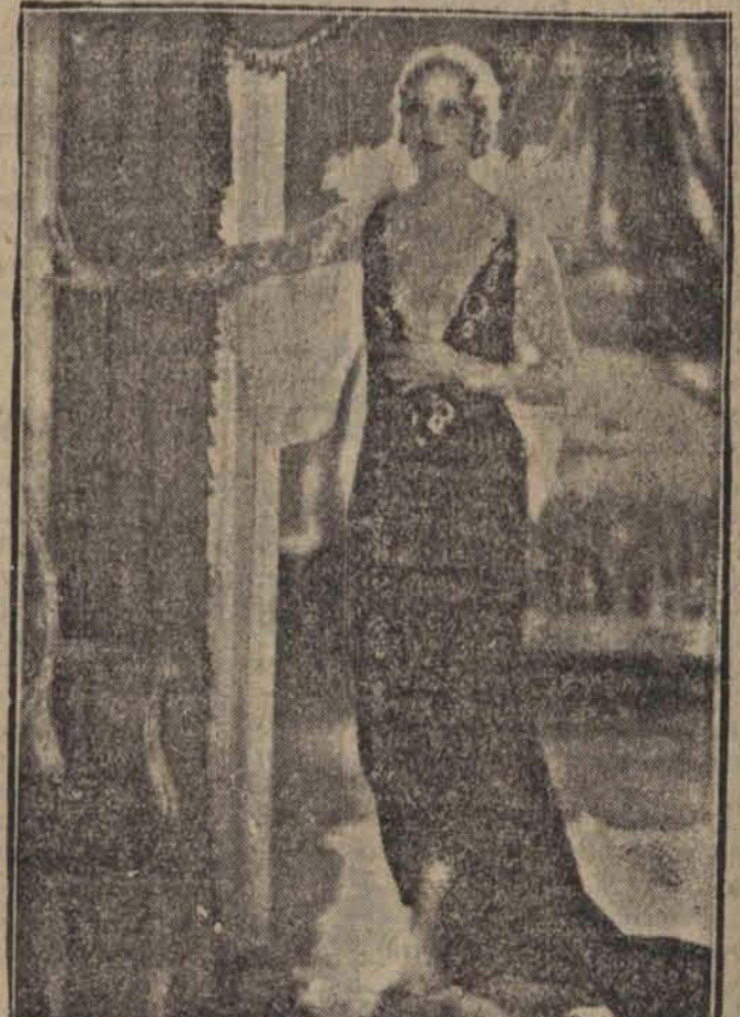
Piękna kobieta na ekranie jest zawsze zjawiskiem milem i pociągającym zysorowie amerykańscy w poszukiwaniu zgrabnych sylwetek „wyłowili” mu statystkę nową gwiazdę, którą Polska pozna w filmie dzwiazki „Tancerka Cilly”.