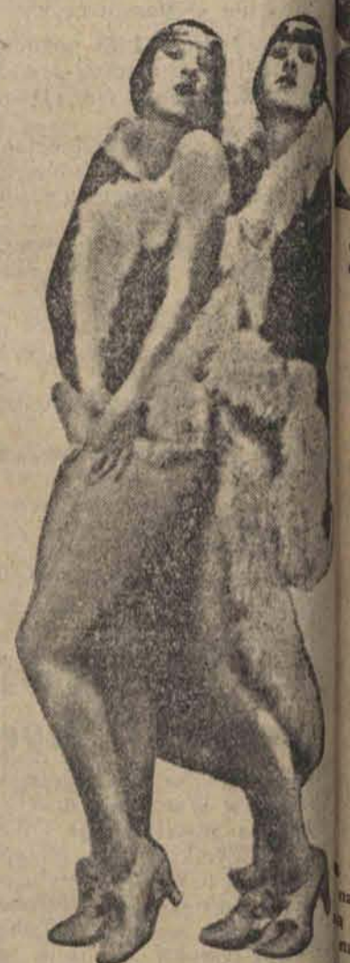
w rewii filmowej p. t. „K...

karty fabrykowane potajemnie przez firmę amerykańską, będącą pod zarządem syndykatu Al Capone. Jeden z wywiadowców zdołał wydstać katalog tej oryginalnej „fabryki”, zawierający