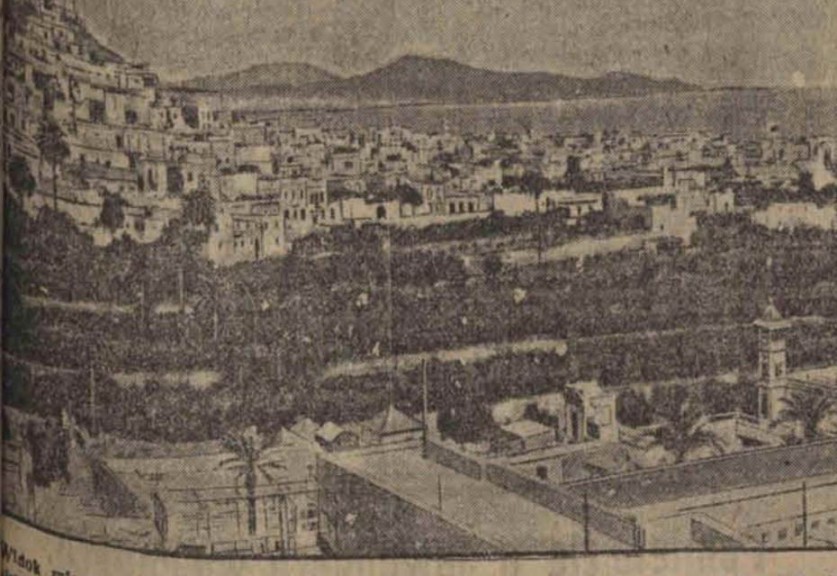
Widok miasta Las Palmas na wyspach Kanaryjskich, którego większa część została zniszczona wskutek osunięcia się góry. Kilkadziesiąt domów legło w gruzach. Boś zabitych nie została jeszcze ustalona (L)