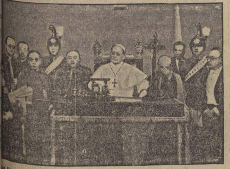
Pius XI przed mikrofonem, przez który wygłosił orędzie do całego świata. (F.)