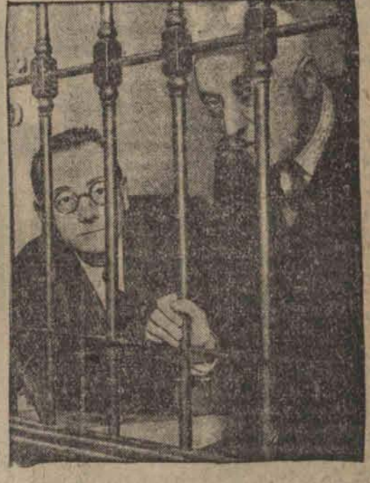
Jeden z przywódców ruchu rewolucyjnego Don Niceta Zamora (po prawej stronie) w więzieniu madryckim.