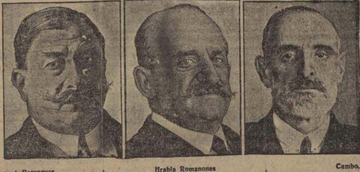
General Berenguer, przywódca liberalów, — swoje ustąpienie wobec widma rewolucji, — swoje ustąpienie ze stanowiska premiera, hrabia Romanones, przywódca liberalów, — ma utworzyć nowy gabinet, Cambo, przywódca rewolucyjnych Katalończyków, — ma wstąpić do nowego gabinetu.