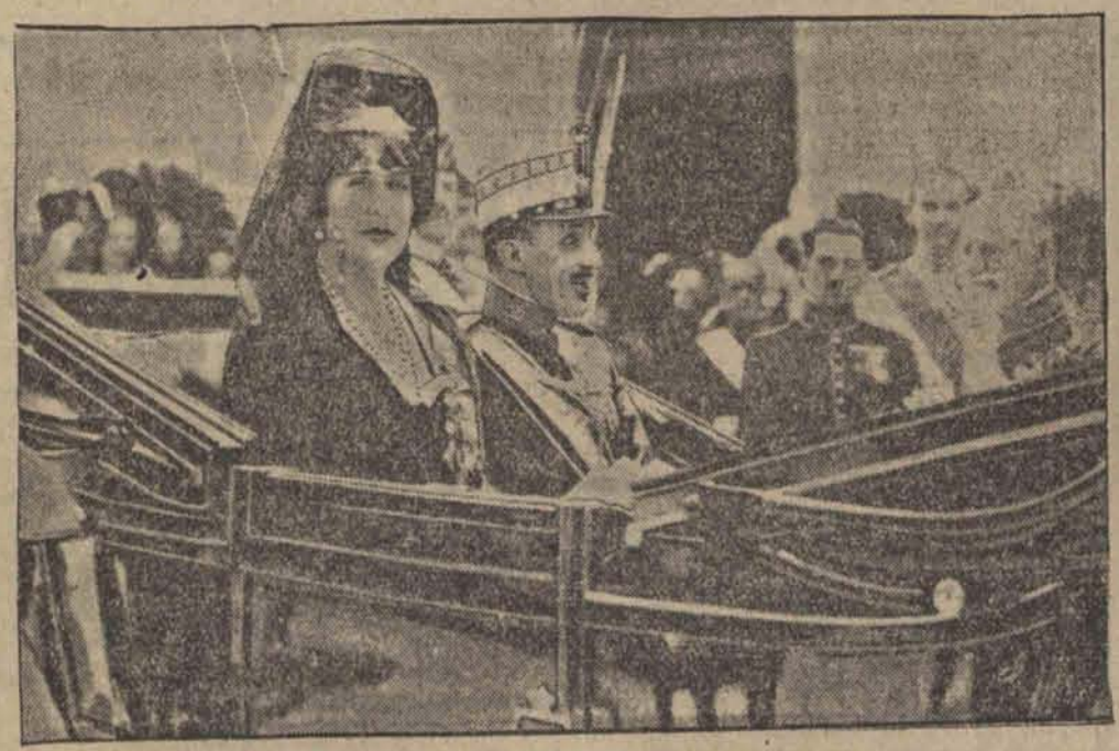
Król Alfons XIII z żoną królową Wiktorją podczas przejazdu po Madrycie. Ostatnie depesze z Hiszpanji donoszą o rzekonym zamiarze abdykacji Alfonsa na rzecz swego kuzyna Don Carlosa.