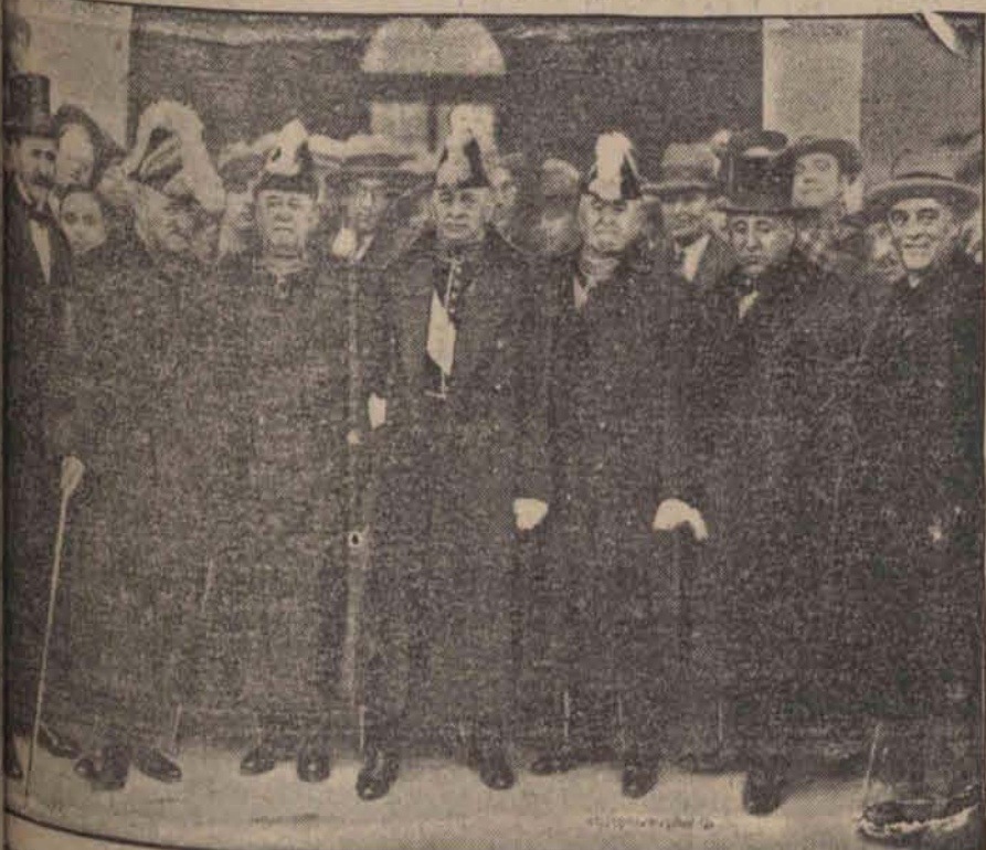
Nowy gabinet hiszpański po zaprzysiężeniu. Od lewej strony ku prawej: Moyos (spr. wewn.), Romanos (spr. zagr.), Bugallal (gosp.), Alkucemas (spraw.), La Cierva (Wyżywienie) i Maura (Pracy).