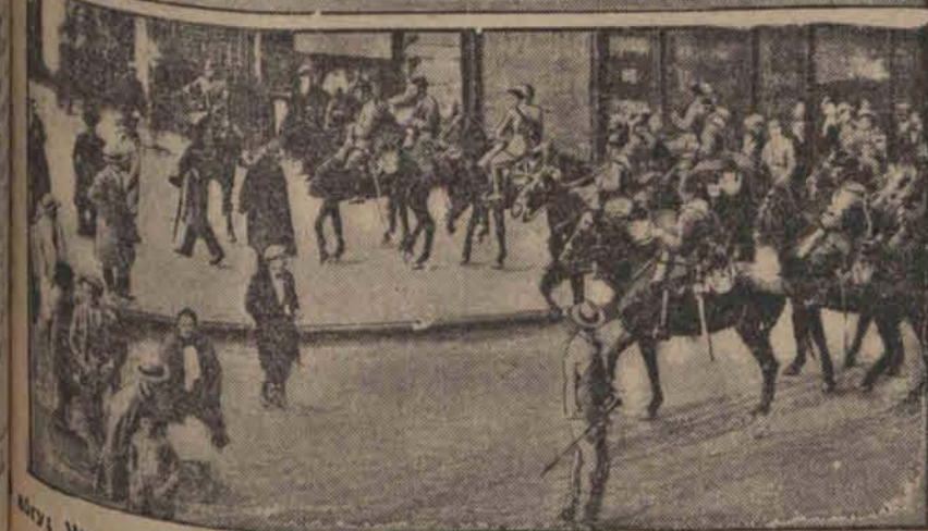
Wesoła scena uliczna w „ostaci”. U dołu: Tego samego dnia policja rozpędza demonstrantów. (F)