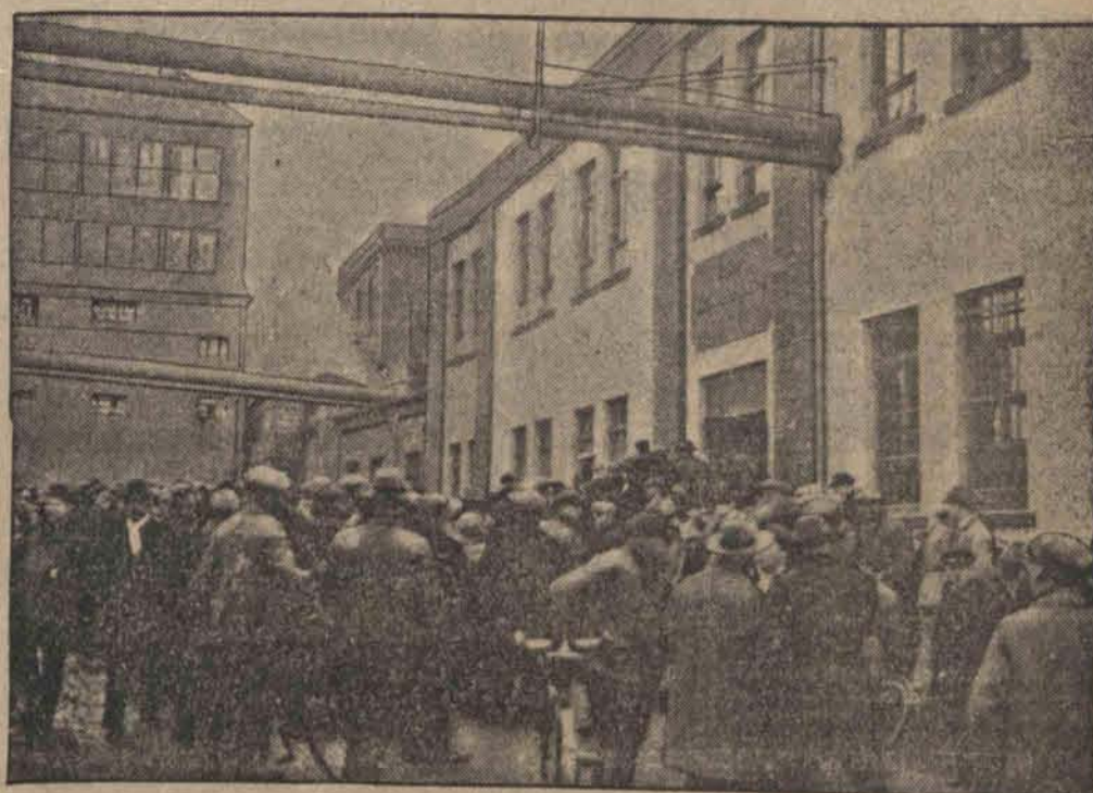
Rodziny zabitych podczas katastrofy w pobliżu Akwizgranu górników oczekujących z listem na wiadomość z podziemi kopalni. W katastrofie tej zginęło 82 górników, ojców iluznych rodzin. (F)