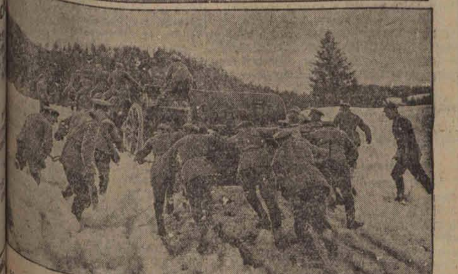
Manewry Reichswehry na olbrzymią skalę wśród najtrudniejszych warunków terenowych, (F).