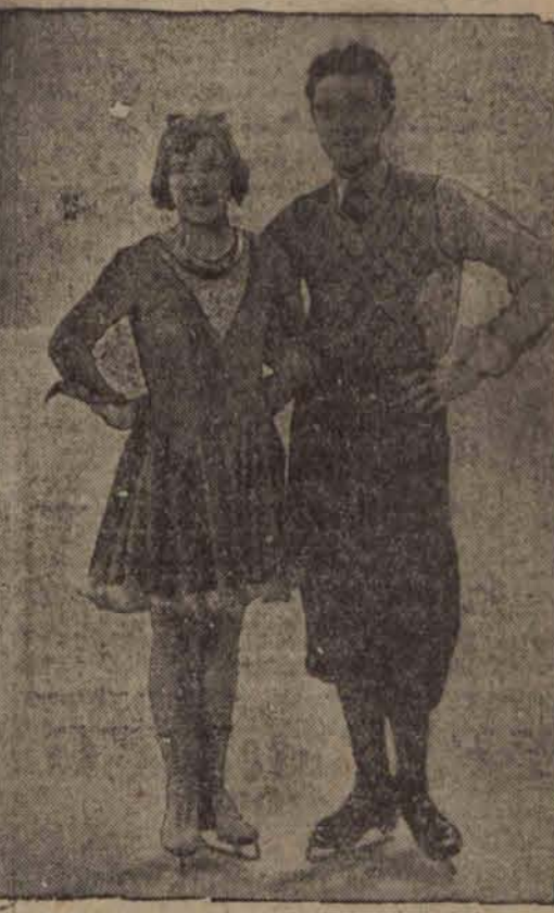
Sonja Henle (Norwegia) i Karol Schae- fer (Włochy) utrzymali tytuły mistrzów świata w pojedynkę również na rok 1931