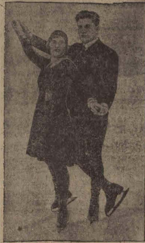
Baby Rottor i Leszko Szollas (Węgry) zdołali mistrzostwo świata w jeździe dwukonnej.