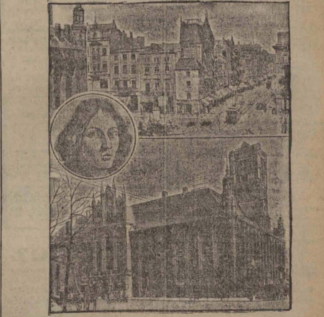
Prastary Toruń obchodził dnia 15 marca 700-letni jubileusz swego istnienia, jako miasta. U góry: Rynek. U dołu: Stary ratusz z 19 wieku. Po środku: Sławny syn Torunia, Mikołaj Kopernik.

Właściciele sklepów nie chcą ponosić uciążliwych kosztów. Warszawa, 8. III. Umowa pożyczkowa z dzierżawcą państwowego monopolu zapalczanego w Polsce podniosła ceny na zapalniczki o 10 złotych, a srebrne nawet o 20 złotych. Tyczy się to również zapalniczek, które od kilku lat leżały w sklepach. Właściciele sklepów tytułowych nie chcą ponosić uciążliwych kosztów odesłania zapalniczek do urzędów akcyzowych. Skutkiem tego zapalniczki z rynku zupełnie znikły.