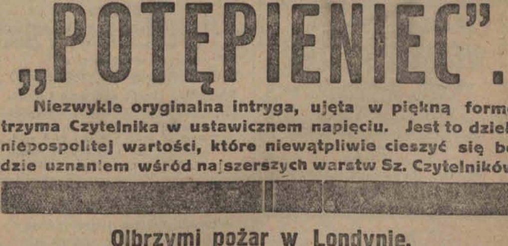
Olbrzymi pożar w Londynie.

Lista P.P.S. unieważniona w Olkuszu. Olkusz, 11 marca. Na posiedzeniu głównej komisji wyborczej w Olkuszu unieważnione zostały dwie listy wysunięte do rady miejskiej przez związek dozorców domowych oraz PPS. Utrzymało się natomiast 5 list polskich i 7 żydowskich. Wybory odbędą się 15 marca.