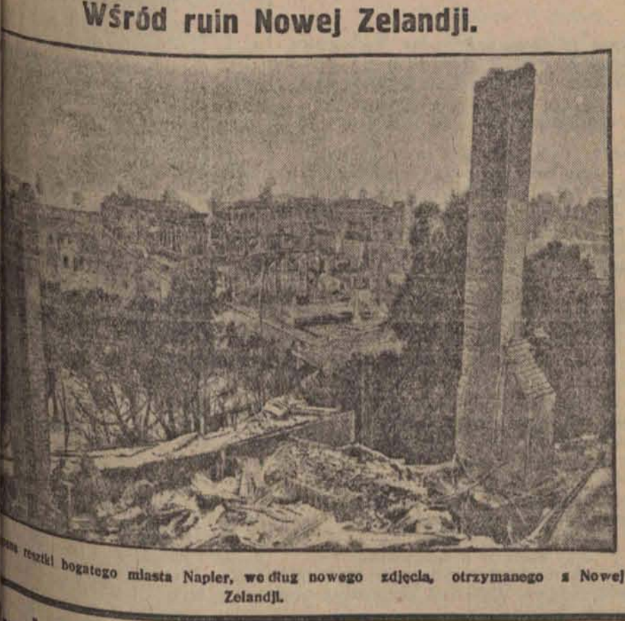
Wśród ruin Nowej Zelandji.

NAD PROGRAM: wspaniałe dodatki i aktualności świata. Początek seansów o godz. 4-ej po poł. w soboty niedziele i święta poranki o godz. 12 w poł. Ceny miejsc normalne na porankach po 73 gr. i 1 zł. Karty premjowe ważne codziennie do godz. 7-ej.