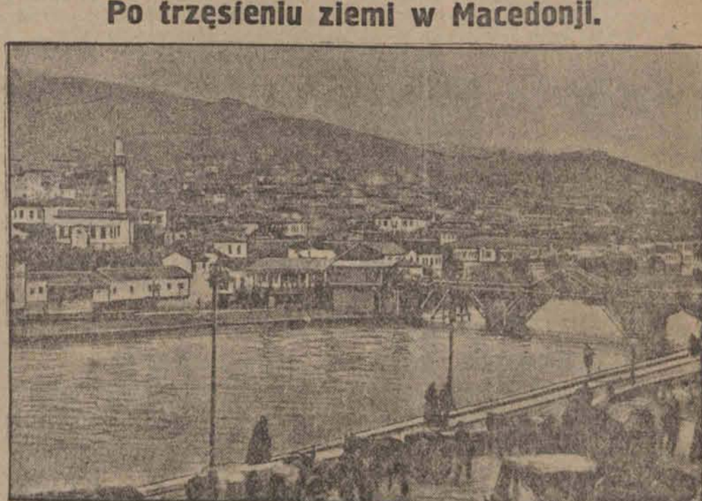
Po trzęsieniu ziemi w Macedonji.

Rumunja otrzymała pożyczkę. 52 miliony dolarów w drodze z Paryża do Bukaresztu. Warszawa, 11. 3. (Od wł. kor.) — Wczoraj po południu podpisana została umowa w sprawie udzielenia Rumunii pożyczki w wysokości 52 milionów dolarów. Umowę podpisał imieniem skarbu francuskiego minister Flandin, za strony rumuńskiej minister Popowick. W finansowaniu pożyczki biorą udział — Bank Paryski i Bank Nadmorski.