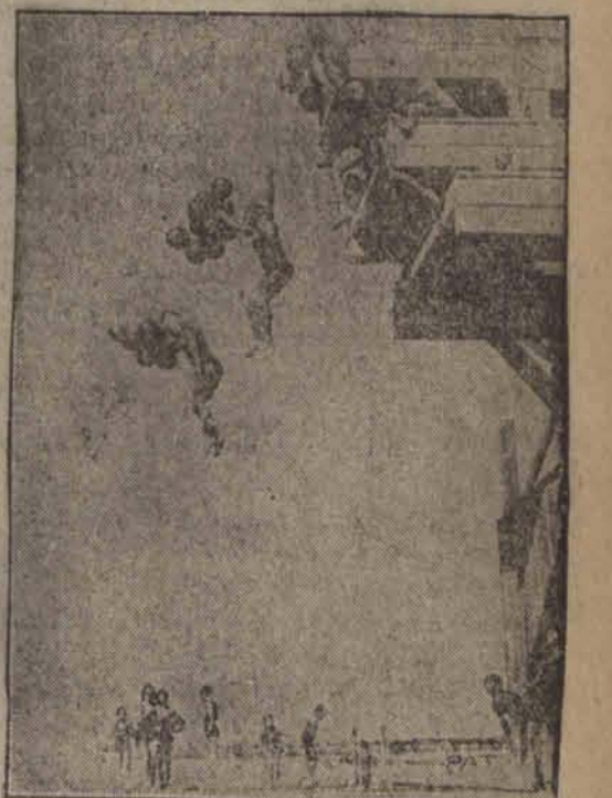
Na plaży w Południowej Kalifornii używa się obecnie „spadochronów” własnej konstrukcji. Kilka baloników związanych „w bokiet” mocno osłabia szybkość i moc spadania i tem samem daje możność skakania do wody z bardzo wielkiej wysokości.