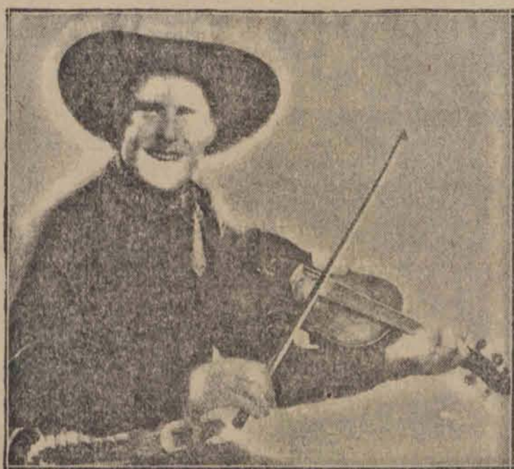
znany z filmu „Senor Americano” święci triumfy w filmach dźwiękowych — „Pieśń Caballera” i „Upiory stepu”.