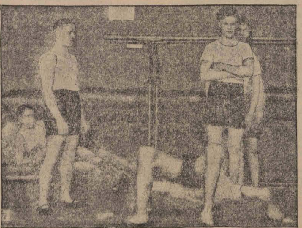
Slepi sportowcy podczas pokazów na międzynarodowym zjeździe niewidomych wykazali, że pomimo swego kalectwa potrafią osiągnąć niezłe wyniki.