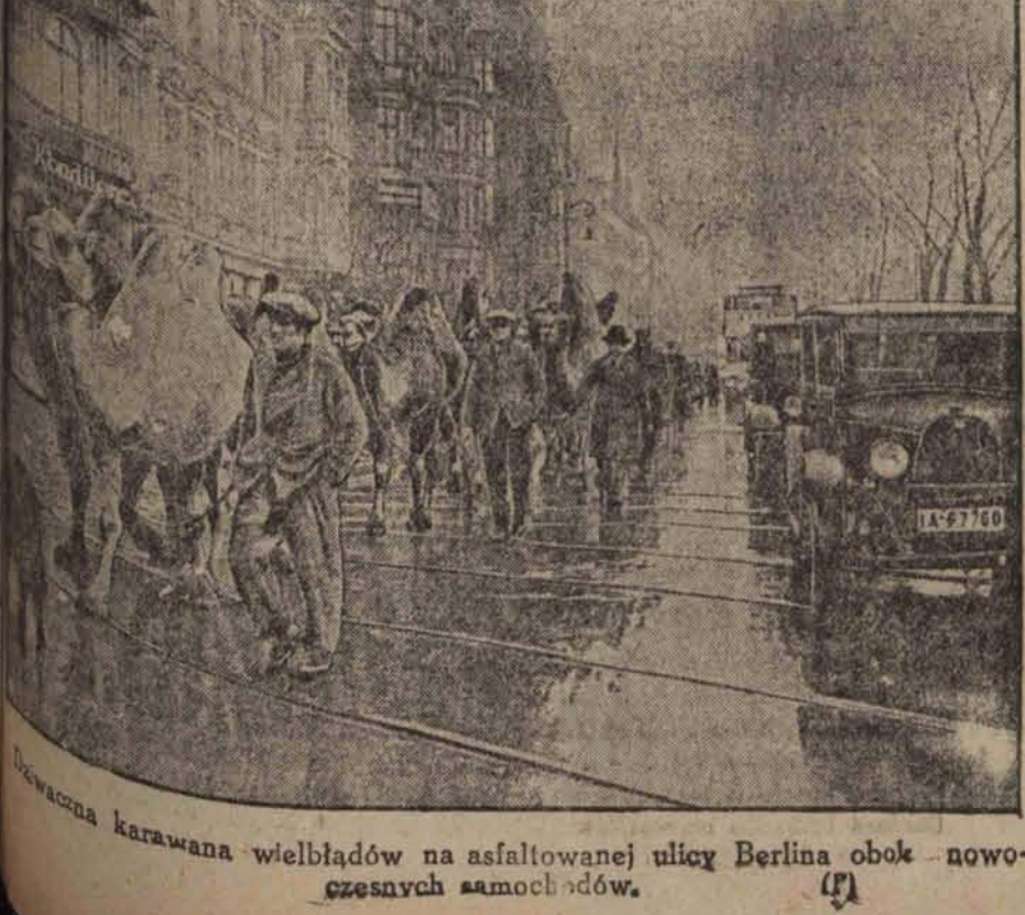
Wielka karawana wielbłądów na asfaltowanej ulicy Berlina obok nowoczesnych samochodów.