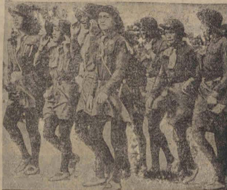
Oddział harcerek polinezyjskiego szczepu Maori, defilujący przed głównym szefem harcerstwa Sir Baden Powellem podczas jego wizyty w Nowej Zelandji

by niewątpliwie zyskały na dyskrekcji przy głosie przyciszonej.