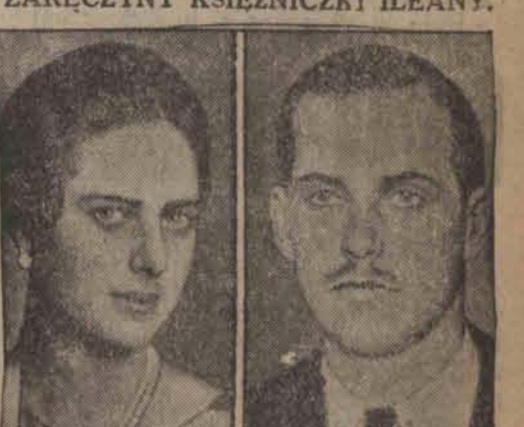
Księżniczka Ileana, 22-letnia siostra króla Karola rumuńskiego, zaręczyła się z księciem Antonim Habsburgiem-Burbonem, znanym lotnikiem.