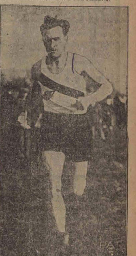
Przy udziale 340 zawodników odbył się w stolicy narodowy bieg naprzelaj, w którym zdecydowane zwycięstwo odniósł Kusociński, wyprzedzając Petkiewicza o przeszło 300 metrów.

żeniem ciała i zmarł po upływie pół godziny. Rozbiegane konie pochwycono dopiero w odległości 4 kilometrów od miejsca tragicznego wypadku.