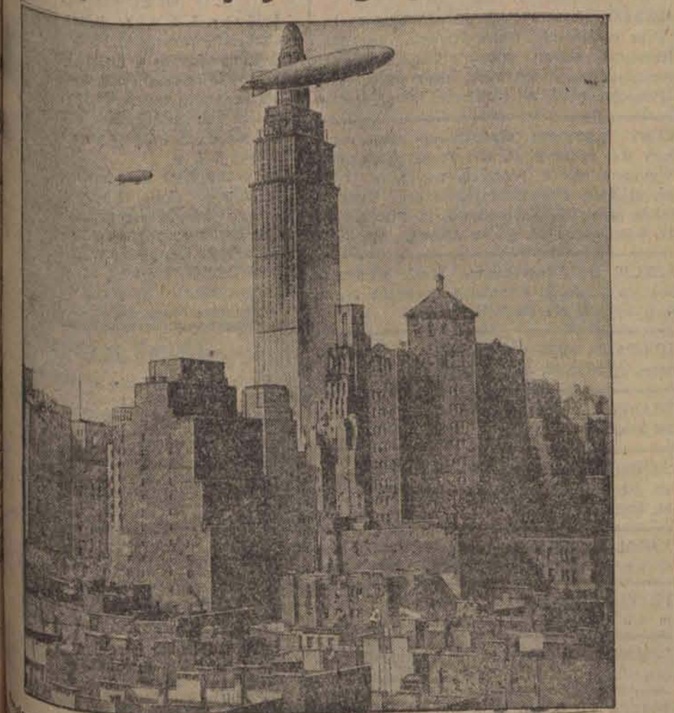
State Building w Nowym Jorku, kt. dla 25,000 mieszkańców) zostało oddane do użytku przez prezydenta Hoovera.