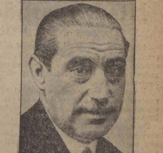
Don Miguel Maura, republikański minister spraw wewnętrznych zgłosił swe wystąpienie z powodu separatyzmu Kataloński.