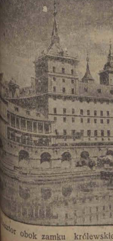
obok zamku królewskiego w Escorialu pod Madrytem, który usiłowali podpalić komuniści.