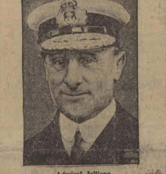
Admirał Jellicoe dowódca floty angielskiej.