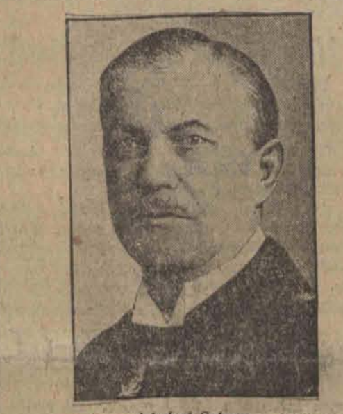
Admirał Scheer dowódca floty niemieckiej.