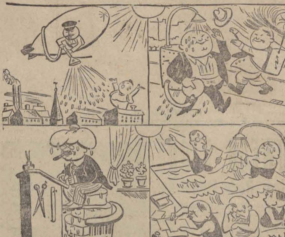
Kilka projektów naszego karykaturzysty umożliwiających przetrzymanie fali upałów, która nas nawiedziła.