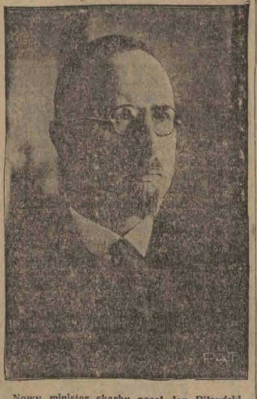
Nowy minister skarbu poseł Jan Pilsudski objął urządowanie