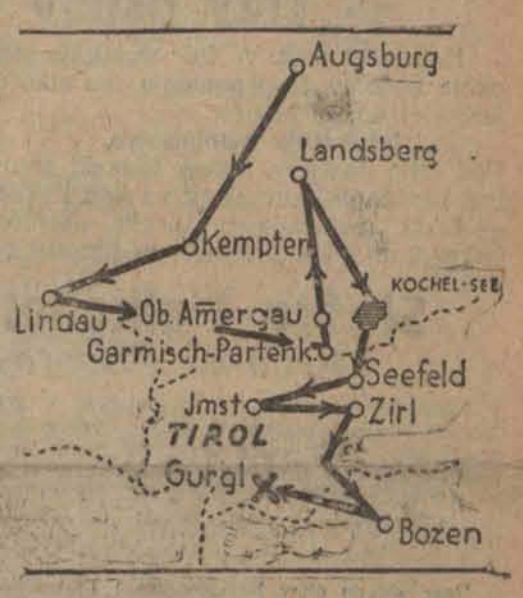
Zyszkawata linia lotu prof. Piccard z Augs- burga do Gurgl.