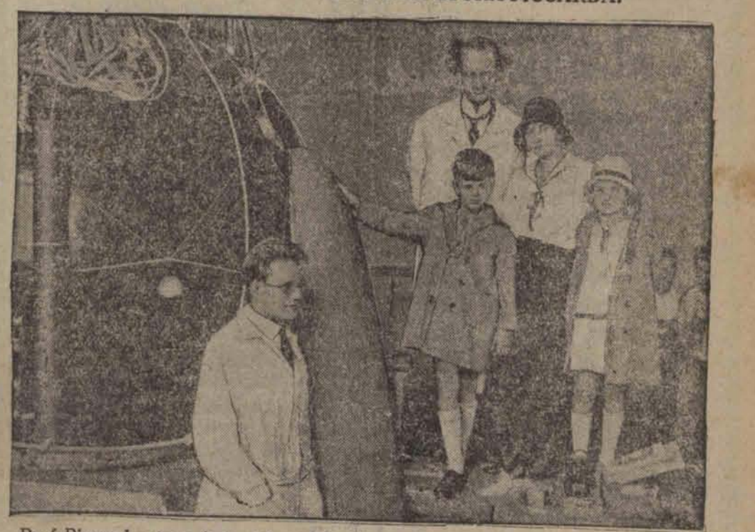
Prof. Piccard z żoną i dwójkiem dzieci przed gondolą balonu. Po wylądowaniu jednego członka, domość, że rodzina jego powiększyła się o jednego członka.