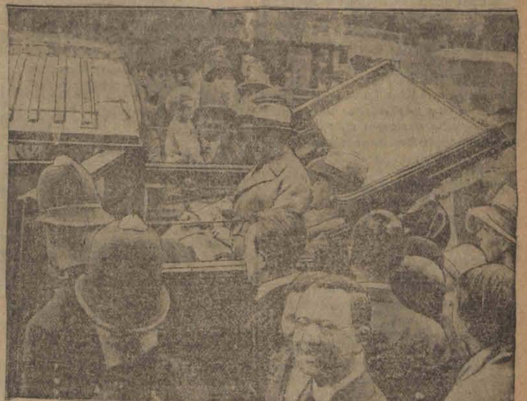
Kancelarz dr. Brüning i minister Curtius budzą zaciekawienie Londyńczyków podczas przejazdu na dworzec kolejowy.