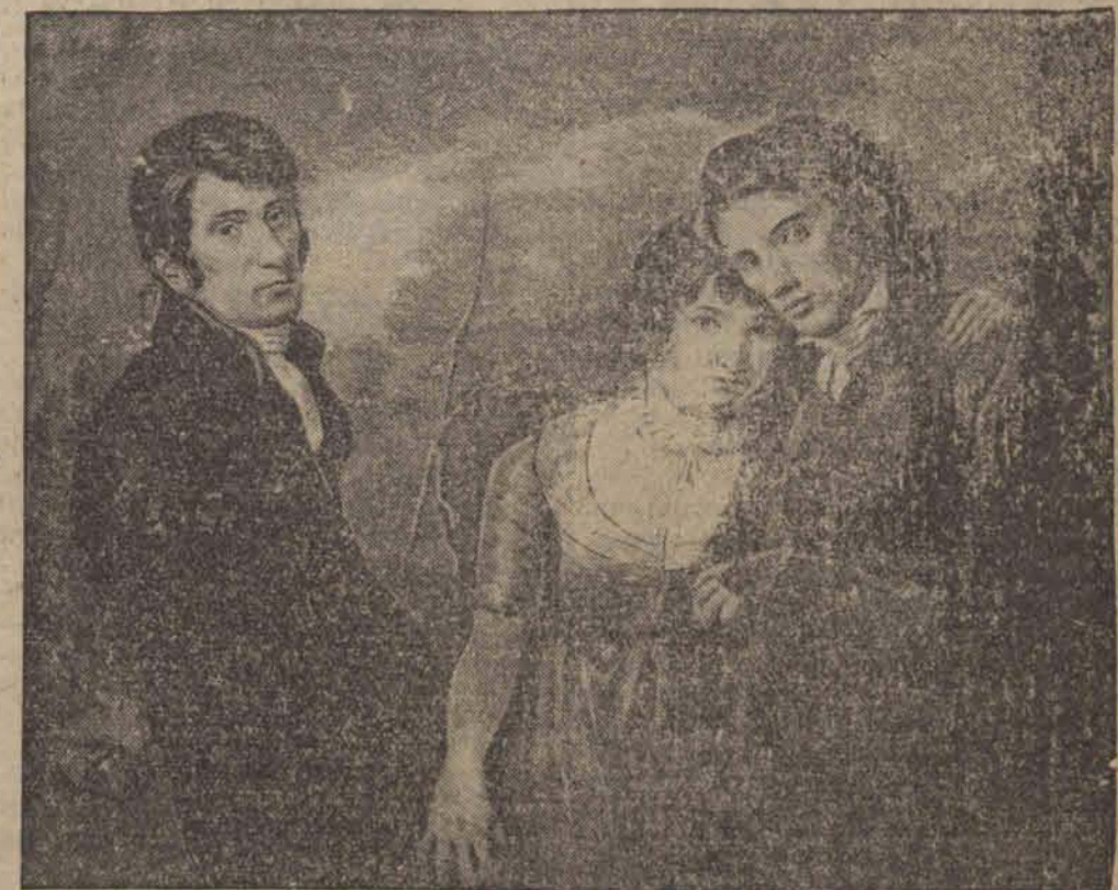
Jedno z 3000 spalonych arcydzieł malarstwa p. t. „Trójka”.