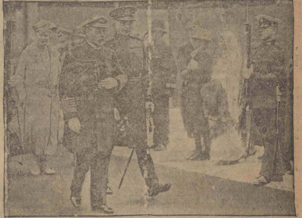
Król Jerzy i królowa Mary są podobnie jak ich poddani entuzjastami sportu konnego. Oboje byli obecni na wojskowym konkursie hippicznym w „Olympia Hallu” w Londynie.