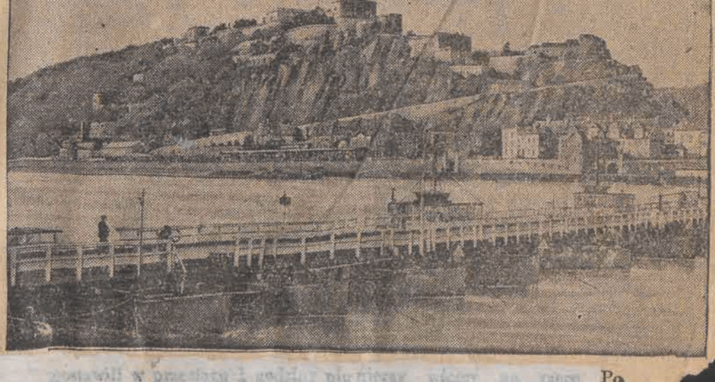
Most w promieniu 1 miliona metrów wzdłuż brzozy wódz na rzece Pa.