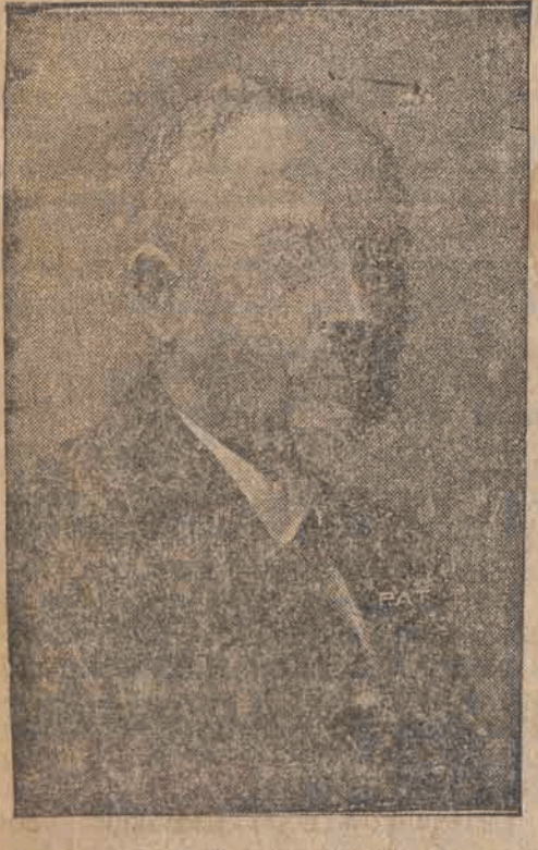
nowy prezes Związku Strzeleckiego.