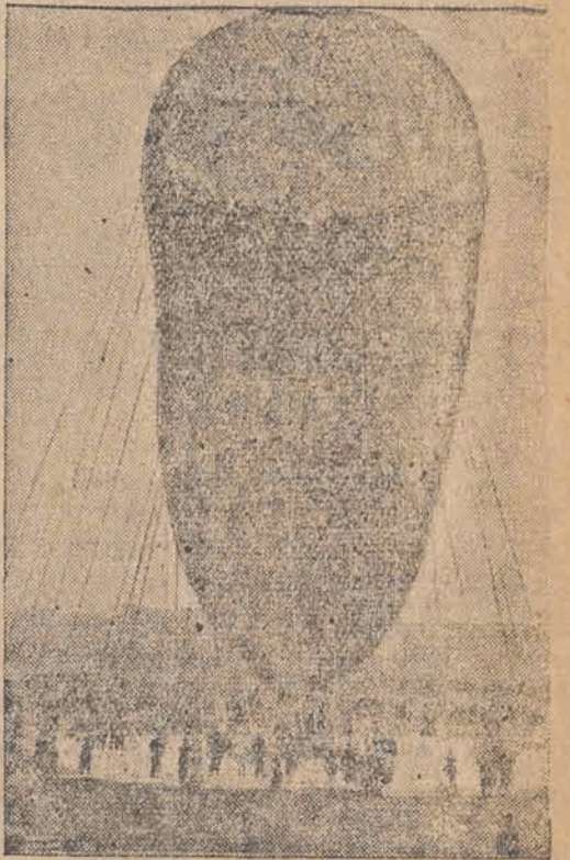
Balon prof. Piccarda na chwilę przed startem, o którym donieśliśmy wczoraj.