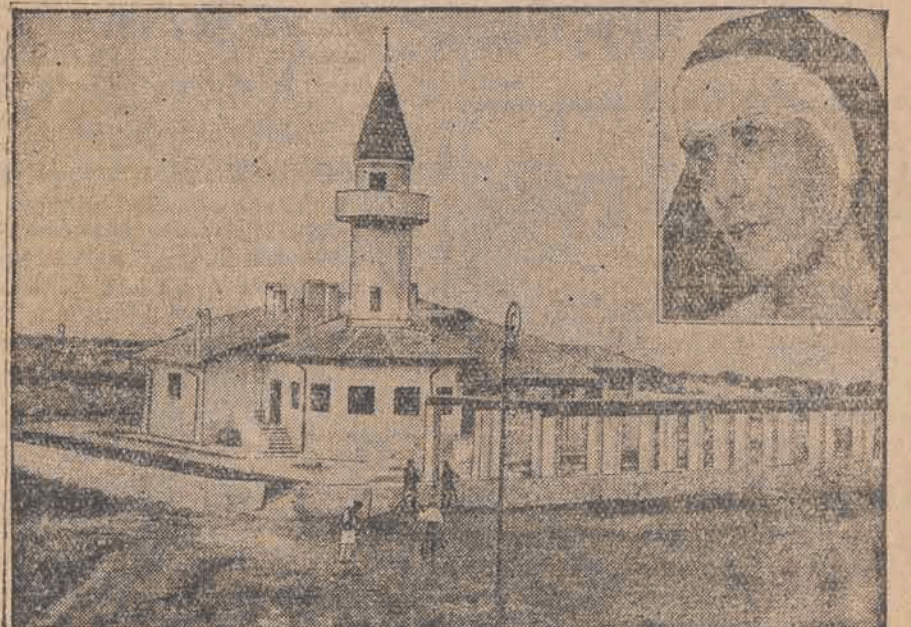
Rumuńska królowa - wdowa Marja wystawiła na sprzedaż swój zameczek nad Morzem Czarnym Balde, by uzyskać środki na opędzenie niezbędnych wydatków.