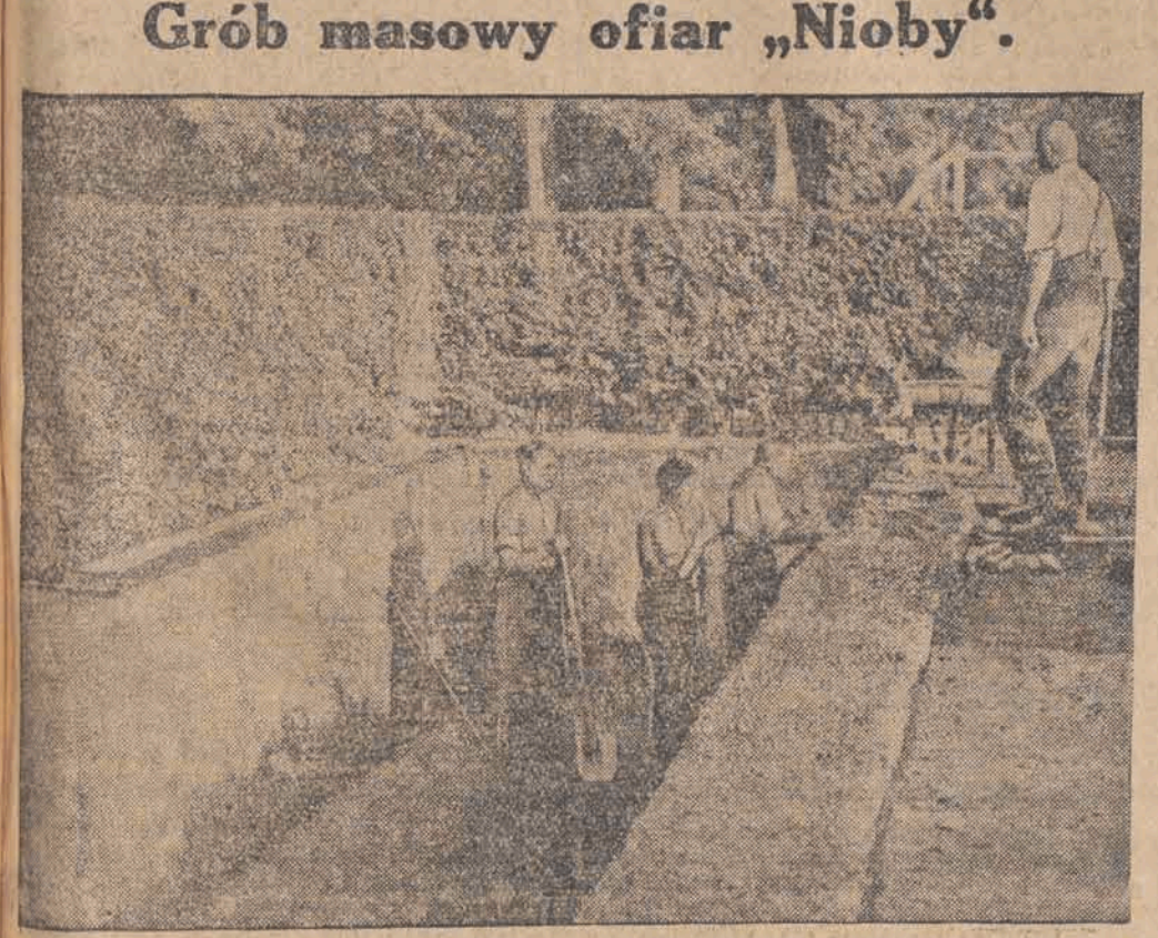
Widziane wraz z okrętem „Niobe” z fal Bałtyku zwłoki kilkudziesięciu młodych marynarzy spoczną w masowym grobie