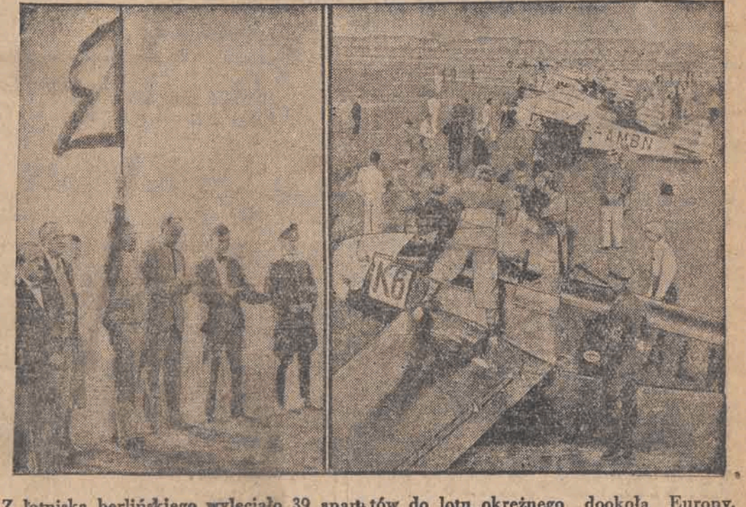
Z lotniska berlińskiego wyleciało 39 aparatów do lotu okrężnego dookoła Europy. Po lewej stronie: Wiceminister Königs daje znak do startu. Po prawej: Ustawione do startu samoloty tu chwila przed odlotem.