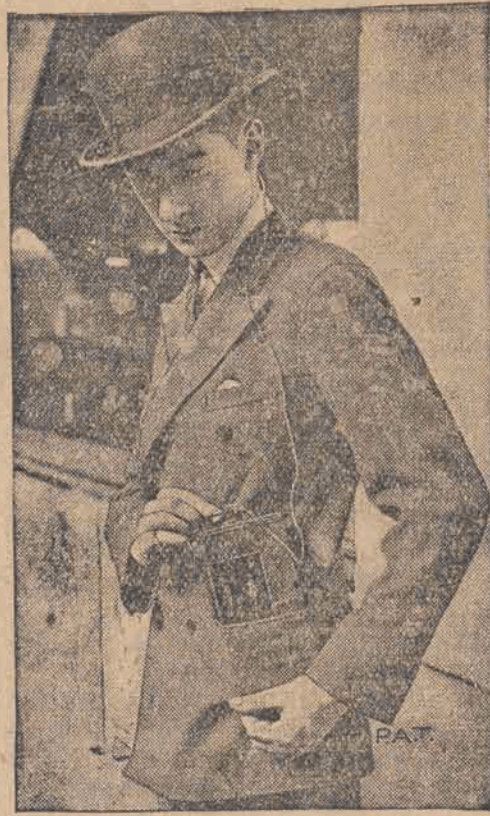
Oto naprawdę kieszonkowy aparat odbiorczy. Głośnik umieszczony jest pomysłowo w kapeluszu. Jest to model, używany przez policje angielską.