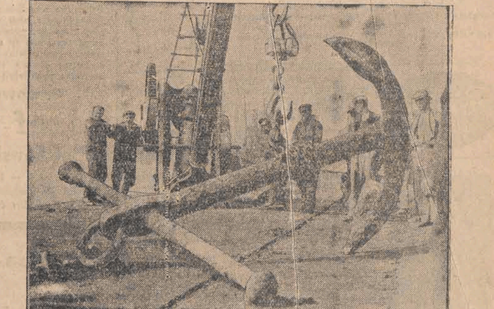
Belgijski holownik „Andrea Jeanne” wylowił w pobliżu angielskich wybrzeży olbrzymią kotwicę, wagi 2000 kg, której wiek określa się na 250 lat.