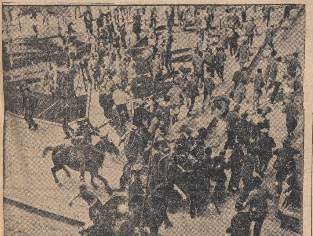
Wojska rządowe rozpędzają demonstrantów. Walki trwały kilka dni i spowodowały śmierć kilkuset osób.