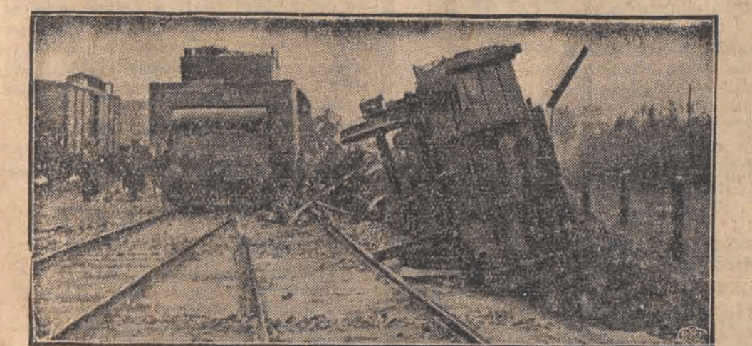
Na zdjęciu rozbite wagony i uszkodzona lokomotywa pociągu towarowego na stacji Widzew.