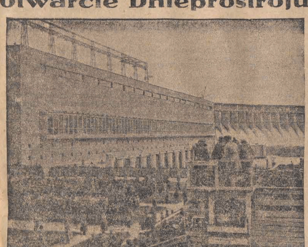
Oryginalne zdjęcie z uroczystości otwarcia „Dnieprostroju“, którego turbiny mają być wykonane w przyszłym roku.

Warszawa, 19.10. W opracowaniu znajduje się projekt reorganizacji korpusu oficerskiego. Chodzi tu jedynie tylko o podporuczników rezerwy, którzy otrzymują nominację po przeszkoleniu w szkołach podchorążych rezerwy i odbyciu odpowiednich ćwiczeń wojskowych. Obecnie podchorążowie rezerwy — jak to przewiduje projekt — nie otrzymaliby stopni podporuczników, lecz mianowani byłiby namiestnikami. W tym stopniu odbywaliby oni ćwiczenia rezerwy, przyczem na okres ćwiczeń wypłacano by im pensje mniejsze, niż dotychczas podporucznikom rezerwy; wysokość pensji namiestników za okres ćwiczeń równałaby się poborom starszego sierżanta w rezerwie, powołanego na ćwiczenia wojskowe. Projekt ten jest podyktowany względami oszczędnościowymi, przyczem w razie zatwierdzenia go przez decydujące czynniki wojskowe można by uzyskać pewne zmniejszenie budżetu M. S. Wojsk. Należy zaznaczyć, że absolwenci (podchorążowie) zawodowych szkół podchorążych awansowaliby podobnie jak dotychczas od razu do stopnia podporucznika. Namiestnicy — według projektu — otrzymaliby automatycznie stopnie podporuczników na wypadek wojny względnie w razie powołania