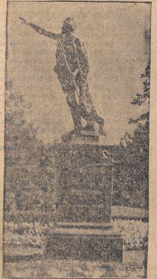
W parku Ujazdowskim w Warszawie ustawiono brązowy posąg dłuta Piusa Welonickiego, przedstawiający gladjatora.